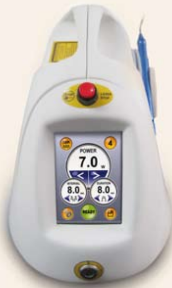
Figura 1. El láser de diodo "Picasso", de la empresa AMD Lasers.

Uno de los autores de este artículo es un dentista a quien no le gustan los retos ni el estrés que produce experimentar con nuevas tecnologías. De hecho, ha intentado usar láseres que prometían ser fáciles de usar, pero resultaron todo lo contrario. La experiencia con el láser de diodo de 810 nm fue totalmente diferente: después de una breve demostración en el consultorio, la pieza de mano del láser era muy cómoda para realizar procedimientos clínicos simples. Unos cursos de formación online y algunas conferencias reforzaron tanto la comodidad clínica de su uso como el nivel de competencia.