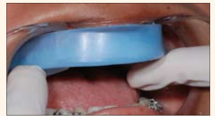
Colocación de la cubeta prefabricada sobre los dientes del maxilar superior.

El poder aclarador del TresWhite Ortho es un beneficio adicional y predecible. El peróxido de hidrógeno tiene un bajo peso molecular de 32 mg/m, lo que permite su fácil difusión del esmalte hacia la dentina 12 . Una vez se difunde a la dentina, las moléculas de oxígeno actúan sobre los pigmentos oscuros rotándolos y fragmentándolos, logrando así un aclaramiento de la estructura dental 14 . El peróxido de hidrógeno aclara de manera polidireccional dentro de los dientes, aún en zonas cubiertas por aditamentos como brackets, lo que hace posible que se logren aclaramientos debajo de estos aditamentos 12 .