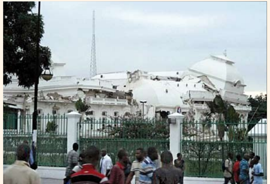
El estado en que quedó el Palacio Presidencial resume simbólicamente el desastre.

centro de operaciones es que la mayor parte de Puerto Príncipe está en ruinas, y que el gobierno dominicano ha trasladado la mayoría de sus recursos móviles de salud allí, en un esfuerzo por tratar a los haitianos que lo necesita y evitar un éxodo migratorio.