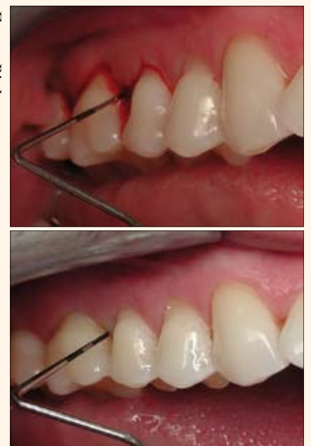
Figuras 13-14. El uso del láser de diodo (Picasso) junto con raspado y alisado radicular acelera la curación gingival y la comodidad en el post-operatorio.