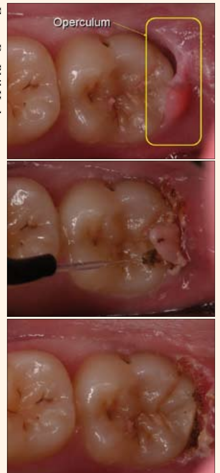
Figuras 9-11. El láser de diodo es ideal para el tratamiento de tejidos hiperplásicos, que aumentan el riesgo de caries y de enfermedad periodontal.