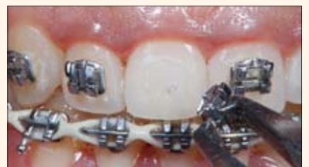
Nótese que una vez retirado el bracket se puede ver claramente que no ha quedado marca o mancha en la zona de adhesión al diente.