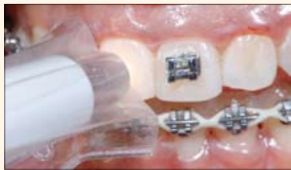
Toma de color con el equipo de espectrofotometría VITA Easy Shade.