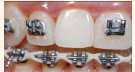
Una vez se retiran los residuos de resina, la zona donde estaba el bracket se observa totalmente aclarada y de color uniforme.