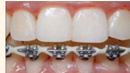
Aspecto de los dientes anteriores superiores una vez retirados los brackets.