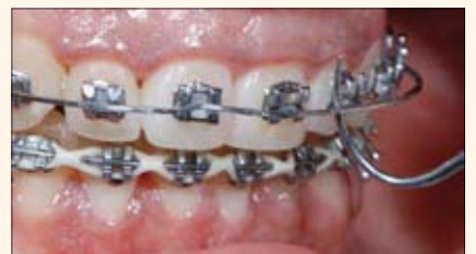
Momento en que se retiran los brackets, 10 días después de iniciado el tratamiento aclarador.