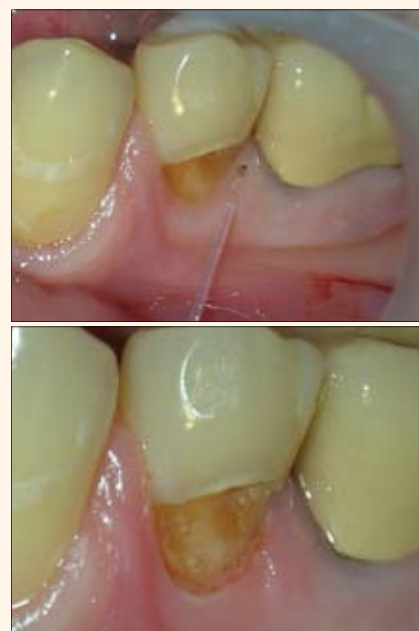
Figuras 7-8. Remoción del exceso de tejido gingival con el "ezlase" de Biolase Technology para mejorar el acceso a la restauración en la preparación de Clase V.