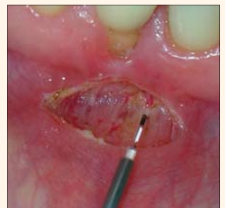
Figura 12. Una frenectomía se vuelve un procedimiento simple con el láser de diodo "ezlase".