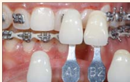
Verificación visual del color obtenido luego de 10 días de tratamiento con el TresWhite Ortho.