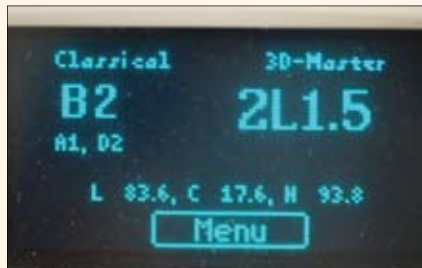
Medición de color en la pantalla del espectrofotómetro y muestra color B2.