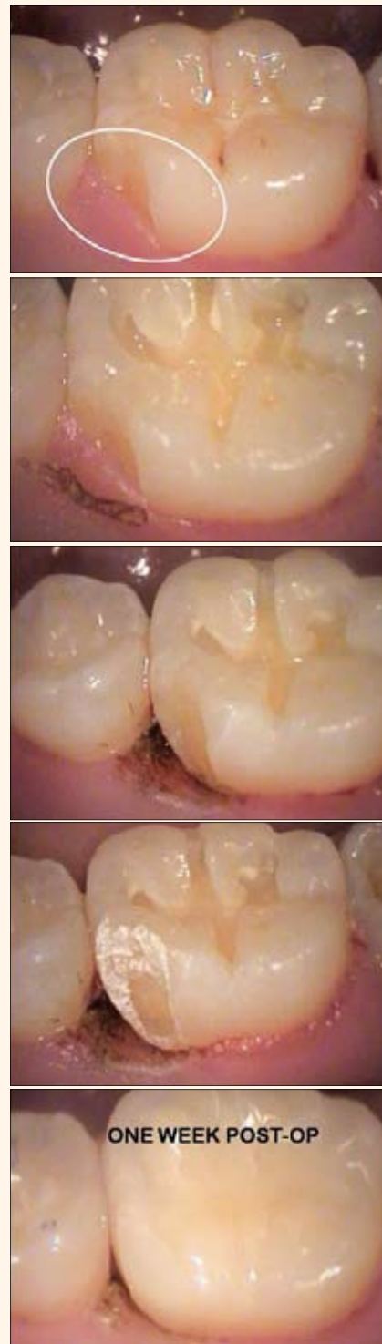
Figuras 2-6. La odontología restauradora es muy fácil con estos láseres, ya que permiten eliminar el tejido gingival de un diente y simultáneamente conseguir hemostasia.