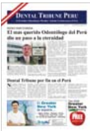
Núm. 0 de Dental Tribune Perú

El Dr. Ochoa ha lanzado una edición nacional de Dental Tribune Perú, que se distribuye conjuntamente con la edición Dental Tribune Latinoamérica.