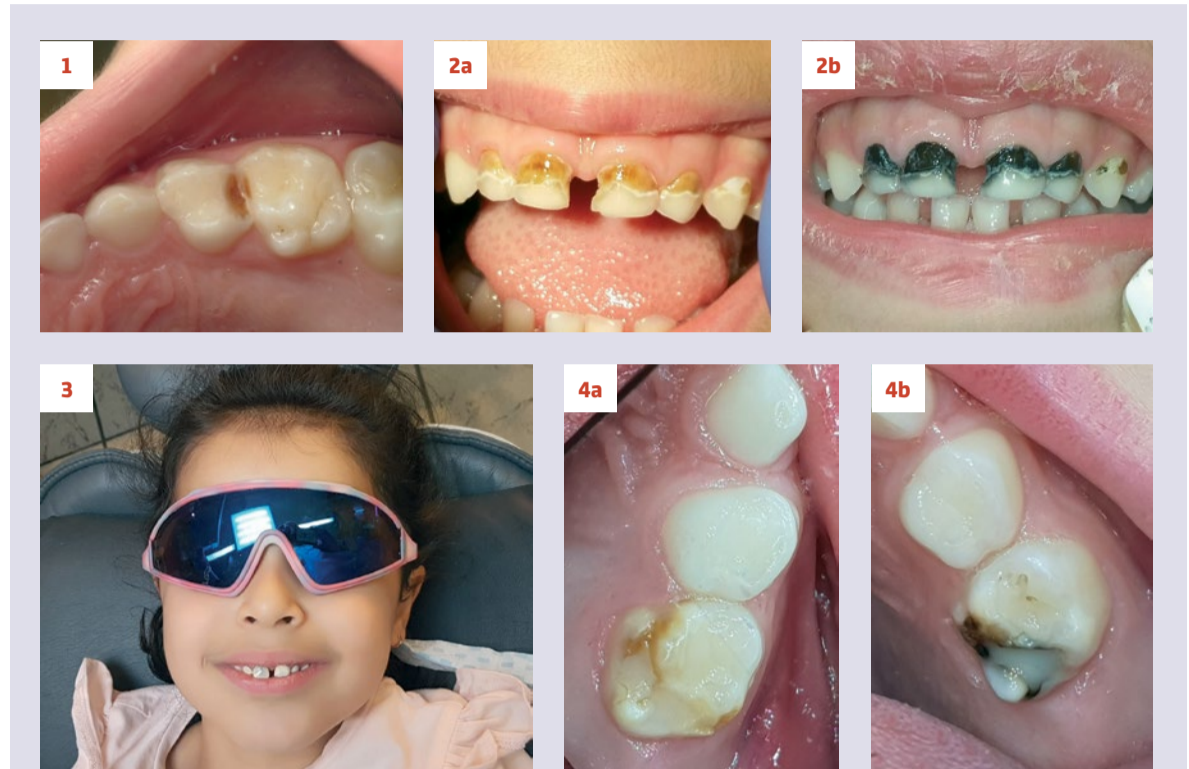
Afbeelding 1. NRCT toegepast bij zeer angstig kind.

Bij onderstaande casussen koos ik voor prioritering van causale the-