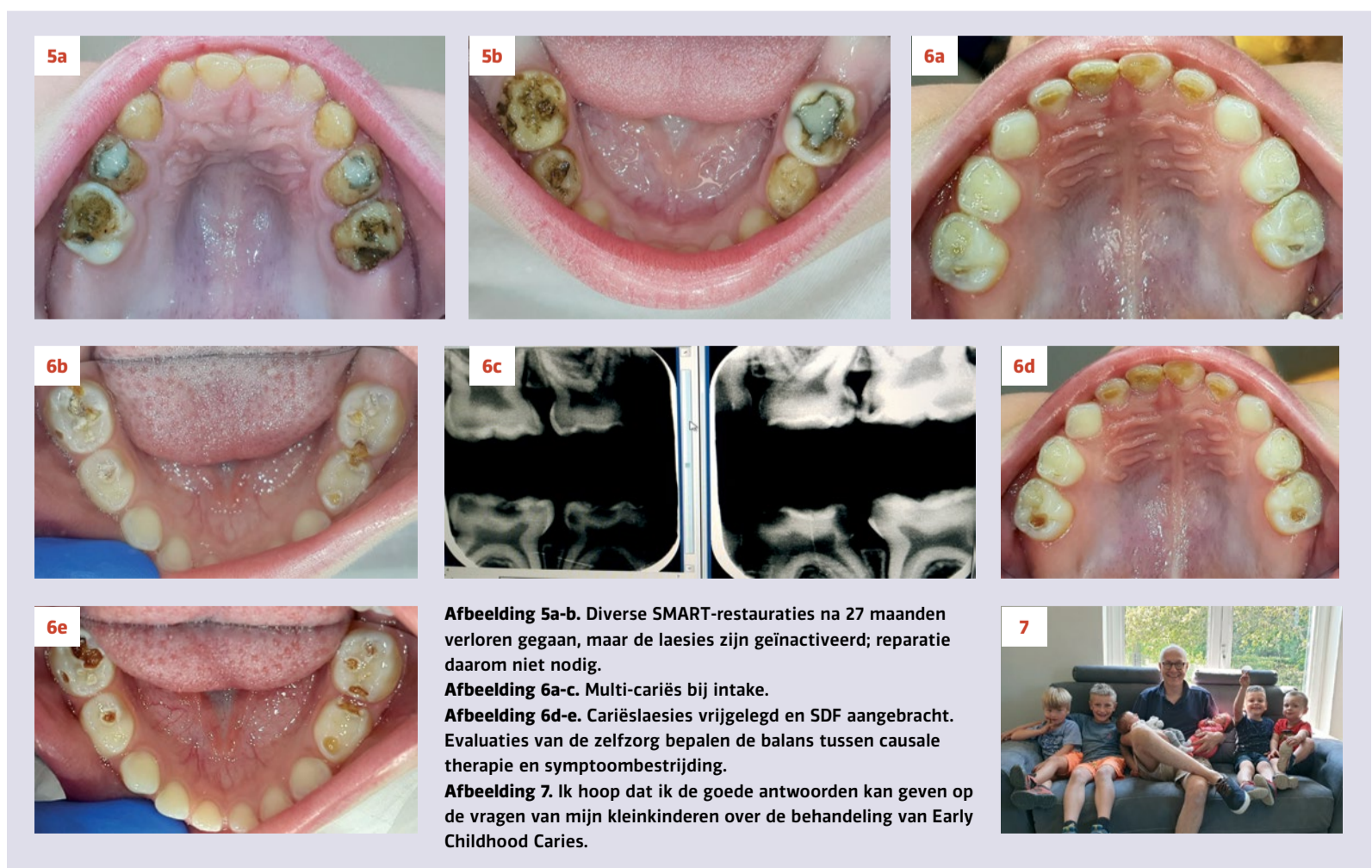
Afbeelding 5a-b. Diverse SMART-restauraties na 27 maanden verloren gegaan, maar de laesies zijn geïnactiveerd; reparatie daarom niet nodig.