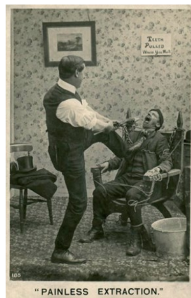
Hoe het publiek ons ziet.

Zijn falingen te wijten aan het anestheticum, de injectietechniek, de patiënt of aan een combinatie van factoren?