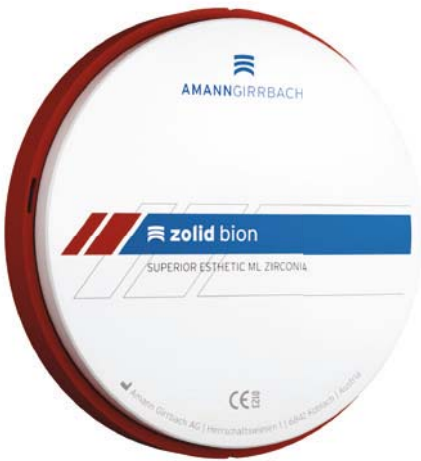
- Zolid Bion.