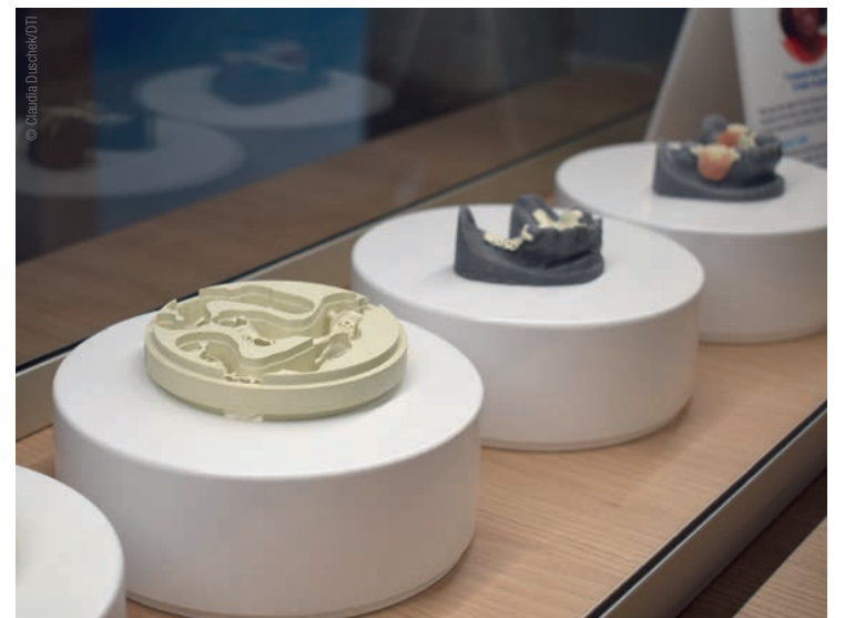
• Dentivera Frässscheiben. • Dentivera milling disc.