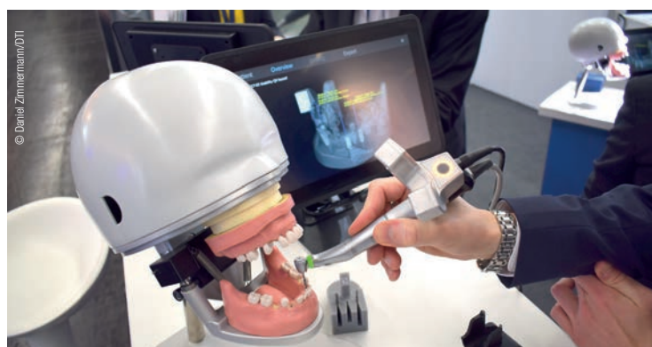
• Das System erlaubt einen Einblick in die Behandlungssituation während einer Implantation in Echtzeit. • The system provides a real-time view of the treatment situation during implantation.

Mr Berlinghoff, thank you for the interview. We wish you every success. ◀