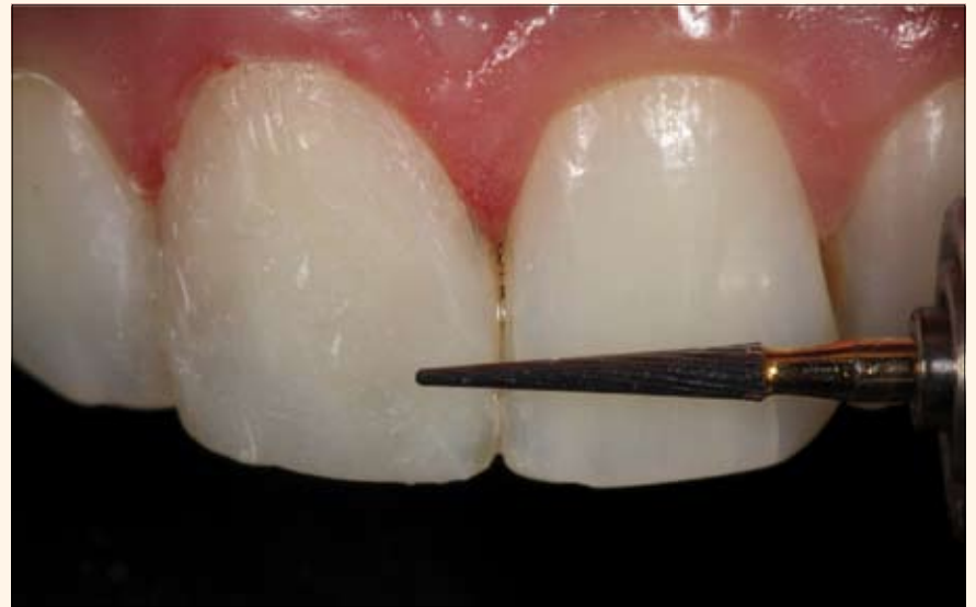
13. Acabado con punta multilaminada 30 Láminas.

tos intenta emular la anatomía y los aspectos ópticos del diente natural (Vichi, et al 2007).