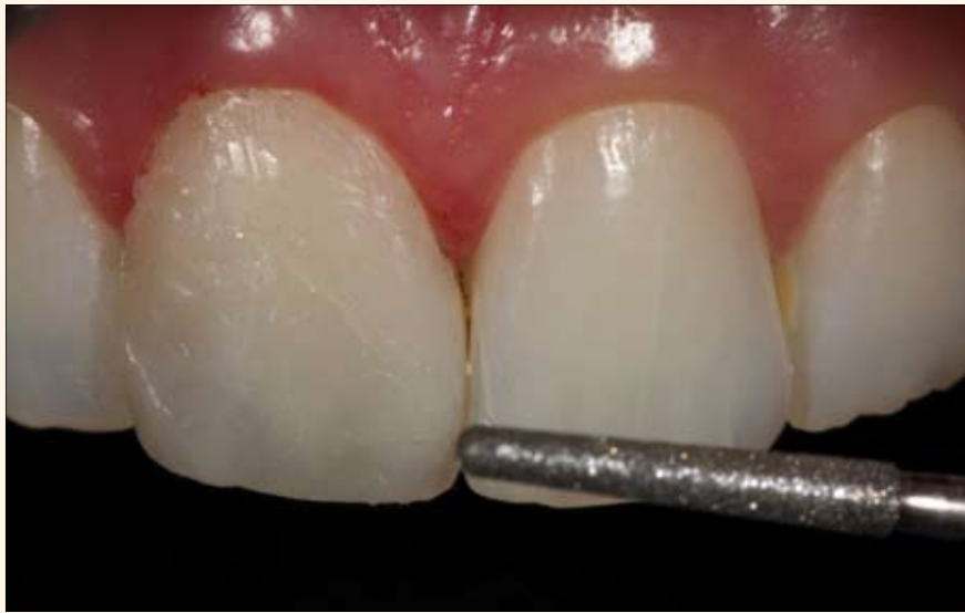
Fig. 12. Acabado con punta diamantada 4138F (KG Sorensen).