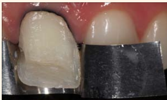
Fig. 5. Preparación finalizada. Remoción de la restauración antigua.