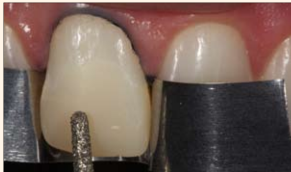
Fig. 4. Inicio de la preparación dental eliminando el material restaurador y preparando la superficie.