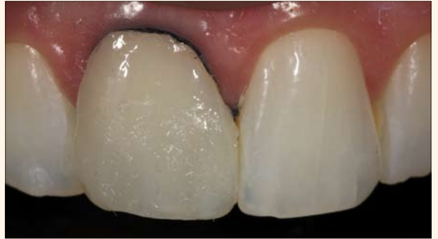
Fig. 11. Aplicación de una pequeña capa de resina Opallis EA1 que simula el tono del esmalte superficial.

La gran ventaja de utilizar resinas compuestas reside en que permiten realizar un procedimiento adhesivo con un desgaste mínimo de la estructura dental y proporciona una retención excelente (Baratieri et al 2010). Para que la restauración tenga un aspecto natural hay que aplicar varias capas de material, cada una de una opacidad diferente. La estratificación de la resina en pequeños incremen-