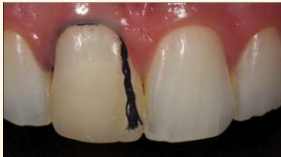
Fig. 3. Hilo retractor para proteger la encía en la región cervical y evitar que el ácido fosfórico y el adhesivo penetren en el surco gingival.