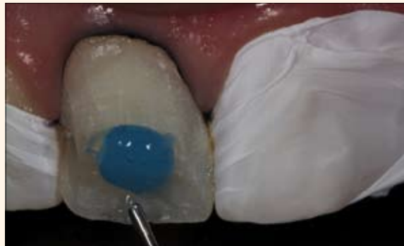
Fig. 6 y 7. Grabado ácido con ácido fosfórico al 37%. Tejido gingival y dientes adyacentes con hilo retractor y cinta de teflón.