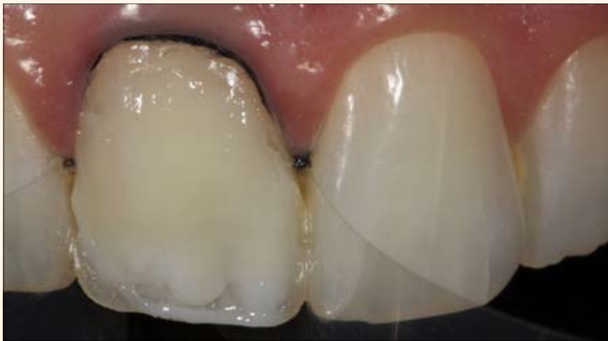
10. Recubrimiento parcial ligero con las resinas Opallis DA1 y Opallis E-Bleach (FGM) para obtener un color similar al de los dientes adyacentes.