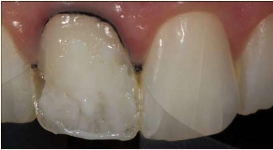
9. Aplicación de la resina Opallis OW (FGM) para cubrir el tono más amarillo del fondo de la cavidad y los bordes opacos.