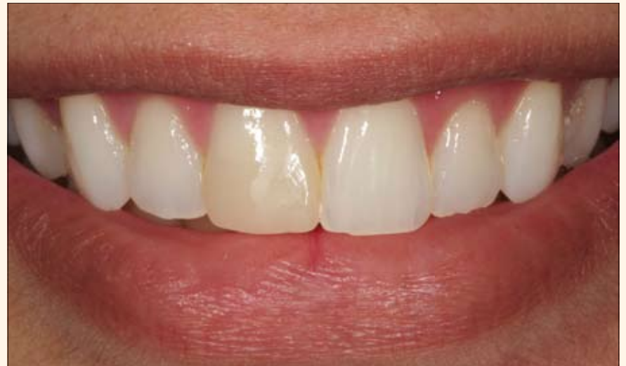
Fig. 1. Aspecto inicial del diente #11. Restauración con resina compuesta bien ejecutada en la que sin embargo después del aclaramiento se observa una diferencia de color en relación con los dientes adyacentes.