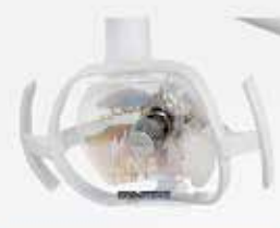
REFLECTOR REFLEX LD CON LÁMPARA HALÓGENA O LED