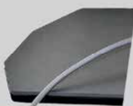
BASE EN ACERO