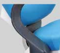
ARTICULACIÓN CENTRAL ÚNICA