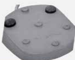
PEDAL DE CONTROL con vuelta a cero, tres posiciones de trabajo y control de intensidad del reflector.