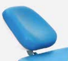
RESPALDO DE CABEZA MULTIARTICULADO