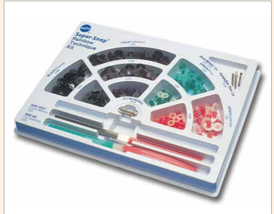
El Kit de pulido y acabado Super-Snap.

Cada uno de los cuatro discos ultra-flexibles codificados por color corresponde a un paso en el proceso de pulido y acabado: negro (contorneado), violeta (acabado), verde (pulido) y rojo (superpulido). Para lograr un brillo húmedo y brillante, Shofu recomienda seguir el procedimiento de cuatro pasos, comenzando con los discos negros, siguiendo con los discos violeta y verde, y concluyendo