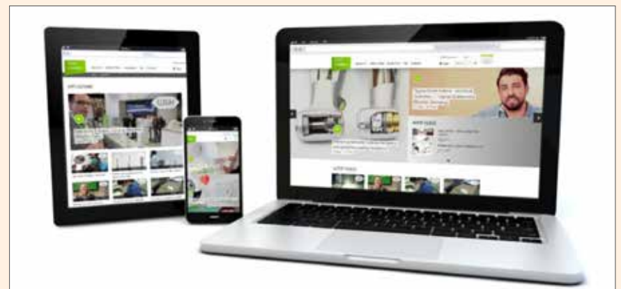
Los vídeos de W&H tienen una calidad óptima en cualquier dispositivo móvil.

Encontrar información sobre productos o sobre la empresa es muy sencillo, gracias a una estructura de navegación clara y a la potente función de búsqueda. Con tan solo escribir las primeras letras de un término de búsqueda aparece una lista de resultados. Gracias al diseño flexible del canal de vídeo de W&H, podrá consultar vídeos e información esté donde esté, con total comodidad. Sea cual sea el dispositivo elegido (tablet, smartphone, portátil o de escritorio), el diseño del canal de vídeo se adapta automáticamente al tamaño de pantalla disponible. Y el canal de vídeo es totalmente compatible con dispositivos móviles Android, Apple y Windows. Así, los clínicos interesados pueden acceder en cualquier momento a una visualización perfecta del contenido. DT