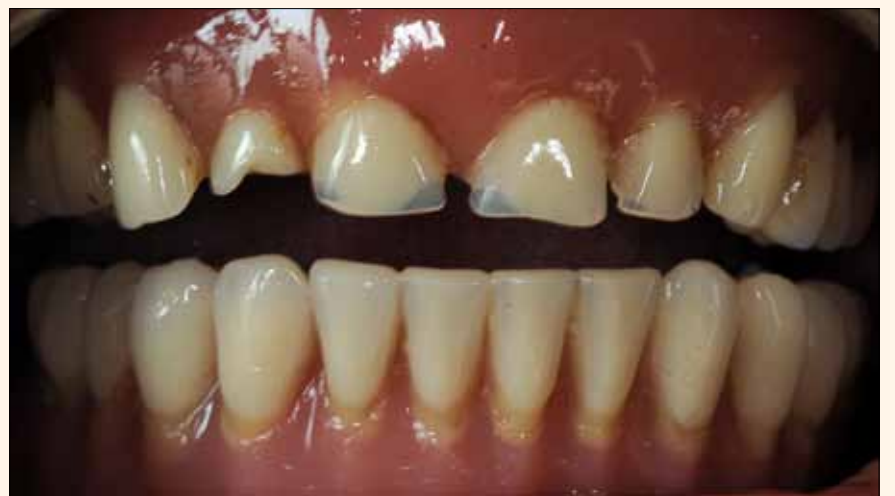
2. Paciente con dilatador en la primera visita.

*Fundador del Laboratorio Dental Borromeo en Italia, especializado en la creación de prótesis para implantes con sistemas CAD/CAM. Colaborador de Pro-cera de Nobel Biocare y actualmente de Dental Wings. Autor de obras como «Realizzazione di un ponte in metallo ceramic in monofusione» (Quintessenza Odontotecnica Rho) y conferencista internacional. Contacto: borrcarlo@tiscali.it