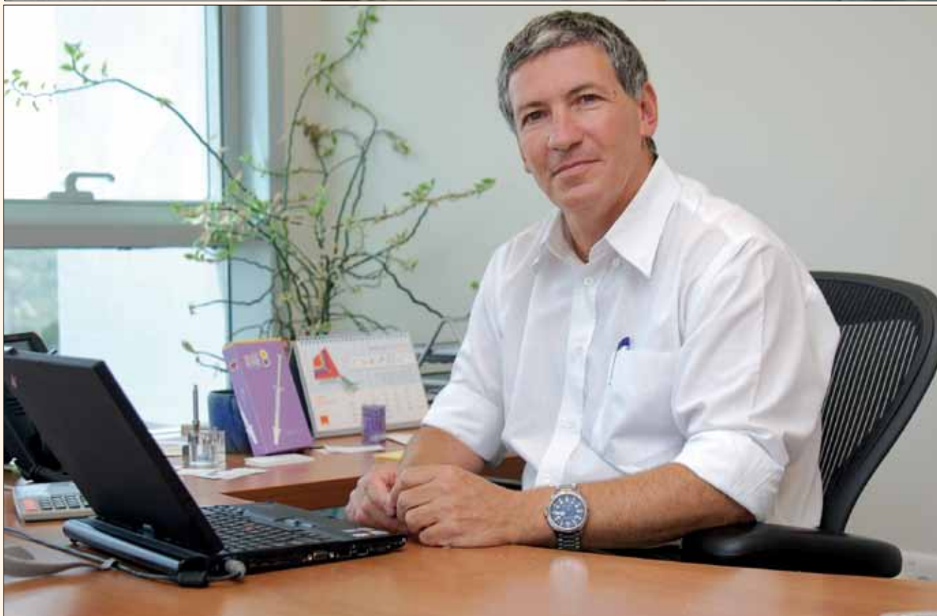
Imágenes de la sede MIS.

y nosotros ofrecemos a los odontólogos tanto cursos de formación básica como avanzada sobre los productos y protocolos de MIS».