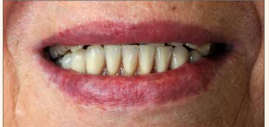
1. Primera visita del paciente.

Tras las evaluaciones iniciales y escuchar las peticiones de la cliente, el protésico y el odontólogo empiezan a pensar en la rehabilitación y a ejecutar el primer montaje de los dientes. Todo esto después de haber tomado las impresiones.