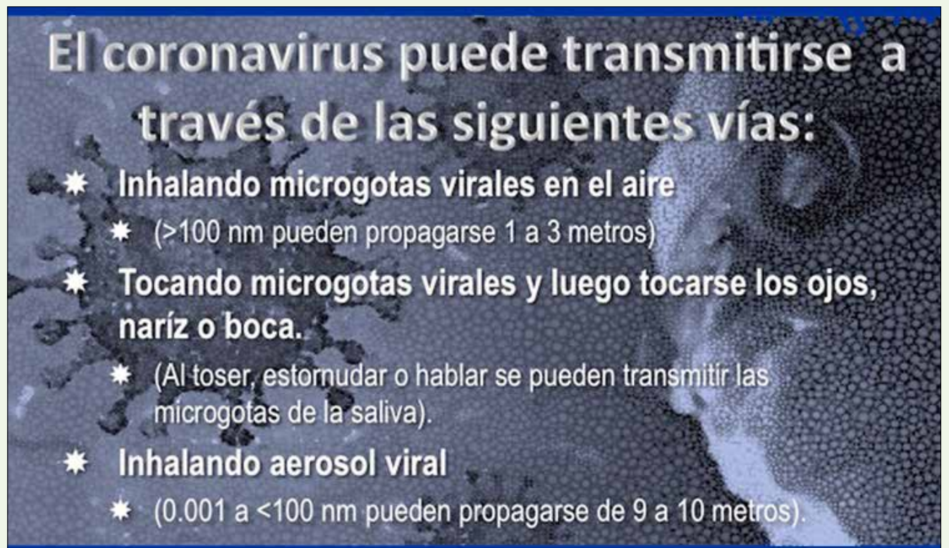
Las microgotas son la vía principal de transmisión del SARS-CoV-2, el virus que provoca la enfermedad Covid-19.

La Guía para el Diagnóstico y el Tratamiento de Covid-19 (5ª edición) publicada por la Comisión Nacional de Salud de la República Popular de China, afirma que la clorhexidina que se usa comúnmente como enjuague bucal no es efectiva para matar al coronavirus. Dado que el SARS-CoV-2 es vulnerable a la oxidación, se recomienda usar un enjuague bucal preprocedimiento que contenga agentes oxidantes (peróxido de hidrógeno al 1% o yodopovidona al 0.2%), con el fin de reducir la carga salival de los microbios orales, incluido el coronavirus. Necesitamos tomar muy en serio el papel que tenemos para ayudar a mi-