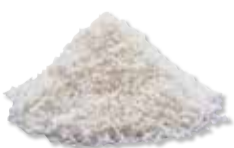
CORTICAL + CANCELLOUS PARTICULATE - MIX Mineralized (FDBA, MIX)