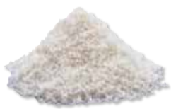
CORTICAL PARTICULATE Mineralized (FDBA)