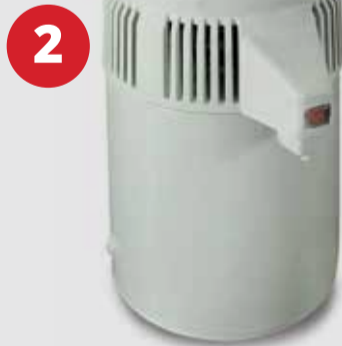
2 Αποστακτήρες νερού Stillo