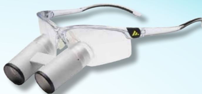
K-Bino 4.2x - 10.0x