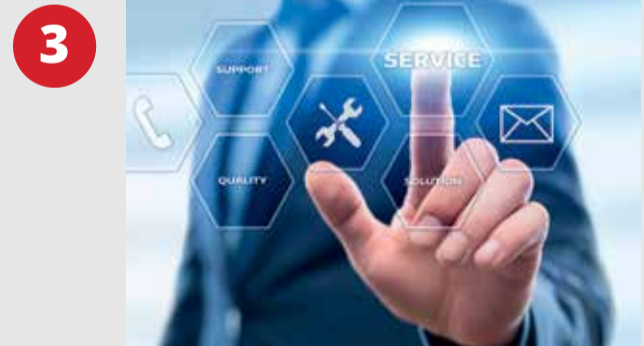
3 Ιχνηλάτηση κύκλων κλιβανισμών

Αποκτήστε εναλλακτικά το μοντέλο 22λίτρων με 200€ επιπλέον.