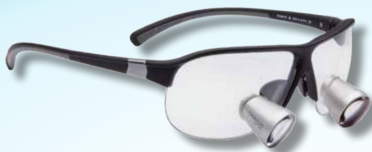
iMag 3.0x - 3.5x