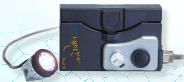
starLight nano 2