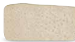
ORACELL Ακύτταρο αλλόδεγμα για ανάπτυξη μαλακών ιστών (Ουλοπλαστική)