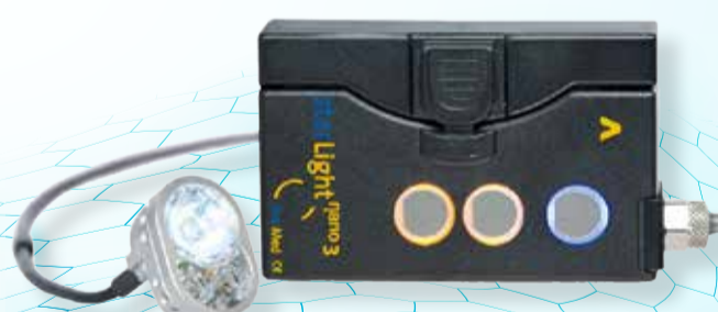
starLight nano 3