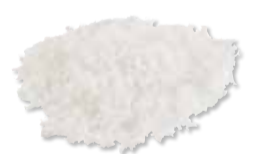
CANCELLOUS PARTICULATE Mineralized