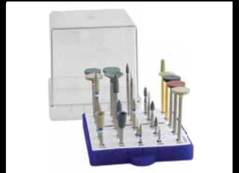
CONTORNO, ACABADO Y PULIDO