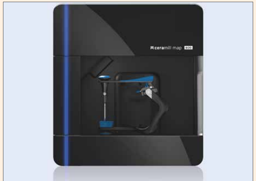
El escáner Ceramill Map 600 ofrece una rapidez insuperable.

El escáner de 5 ejes Ceramill Map 600 permite escanear los modelos articulados directamente en el articulador, sin pasarlos previamente a