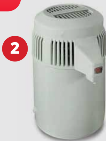
2 Αποστακτήρες νερού Stillo