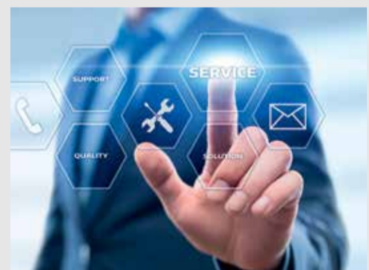
3 Ιχνηλάτηση κύκλων κλιβανισμών

Αποκτήστε εναλλακτικά το μοντέλο 22λίτρων με 200€ επιπλέον.