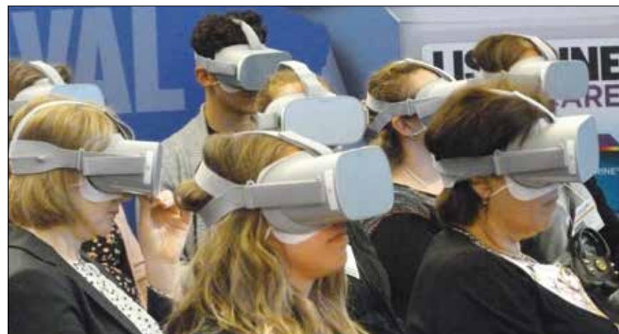
· Les participants entrent dans la réalité virtuelle de Listerine au kiosque de Johnson & Johnson, no 1521. · Attendees enter Listerine virtual reality in the Johnson & Johnson booth, No. 1521.