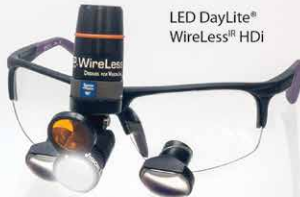
LED DayLite® WireLess IR HDi

Touch-free operation eliminates cross contamination