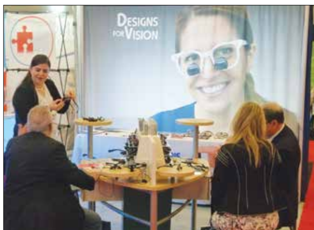
· Rendez-vous au kiosque no 210 de Designs for Vision, afin de profiter des prix spéciaux sur les loupes binoculaires et les lampes. · Find show specials on loupes and headlights in the Designs for Vision booth, No. 210.