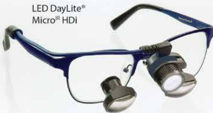
LED DayLite® Micro IR HDi

Fonctionnement sans contact élimine la contamination croisée