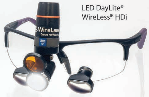
LED DayLite® WireLess IR HDi

Fonctionnement sans contact élimine la contamination croisée