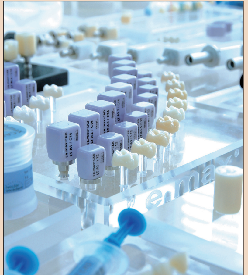
Hosszú évek tapasztalatának s a kiváló Kutatási – Fejlesztési Osztály, eredményeinek köszönhető, hogy az Ivoclar Vivadent minden évben számos újítást dob a piacra.

– Az új bluephase 20i lenyű- göz 2000 mW/cm 2 teljesítmé- nyével, szenzációsan rövid, 5 mp-es megvilágítási idejével. Az egyedi, Ivoclar Vivadent fejlesztésű polywave LED technológia