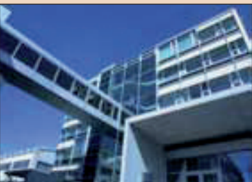
Cégek központ és gyártás Schaanban.

Mindezek egy fog teljes élet- ciklusára vonatkozóan modern kezelési koncepciókat és rend- szer megoldásokat jelentenek.