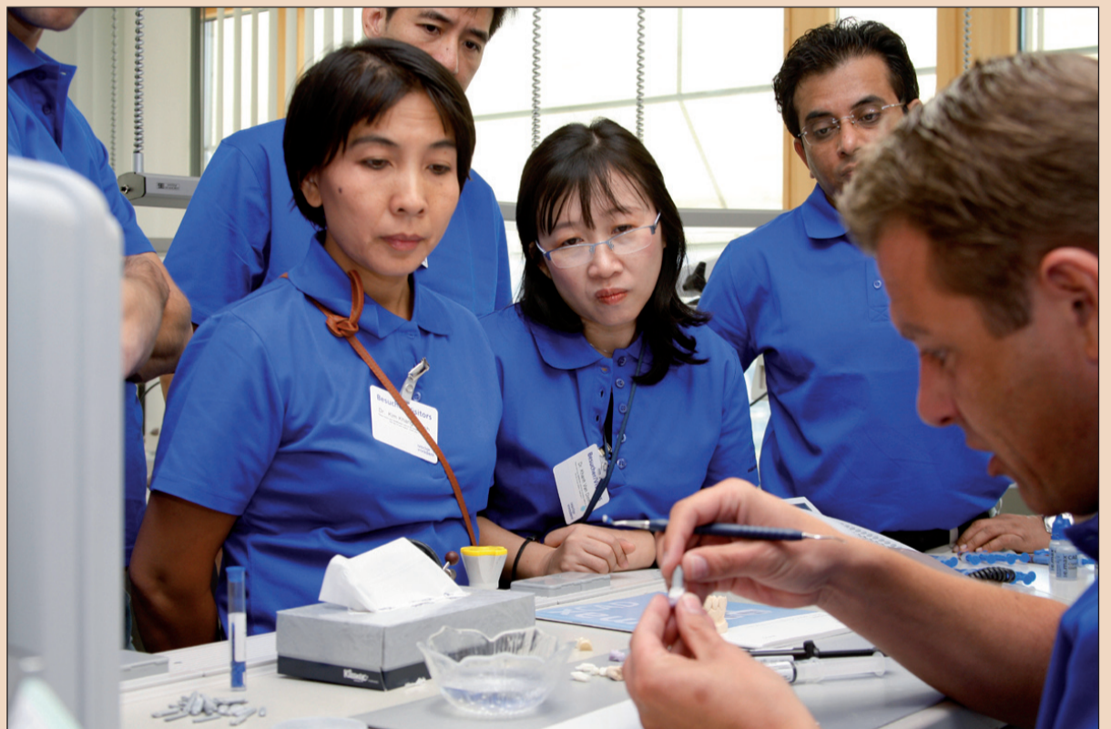
Ivoclar Vivadent: 2220 munkatárs világszer- te.

Világszer- te több mint 15 továbbképző központ segíti a magas tudásszint elérését az Ivoclar Vivadent termékeinek és rendszereinek alkalmazásá- hoz.