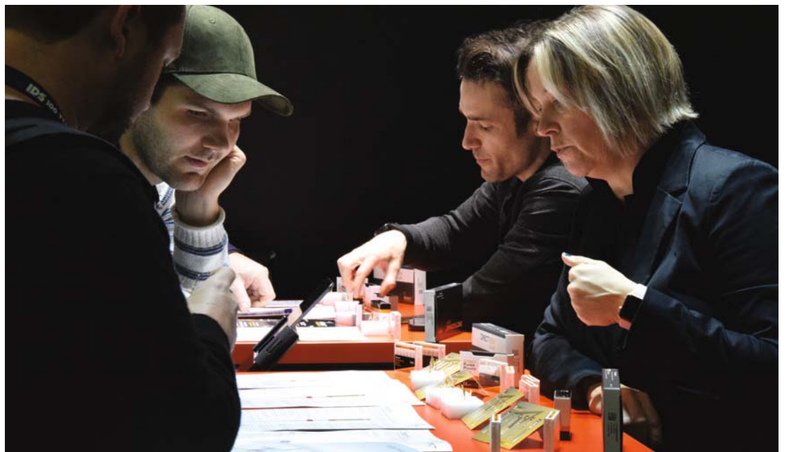
• IDS-Besucher informieren sich über die Produkte von DirectEndodontics auf der IDS. • IDS visitors learn more about DirectEndodontics' products at IDS 2023.

The instruments undergo a heat treatment that really stands out as being both highly effective and efficient. In a world that is rapidly changing and evolving, root canal therapy is evolving too. Clinicians want treatment to be faster without decreasing treatment quality. What I like most about DirectEndodontics' files is that