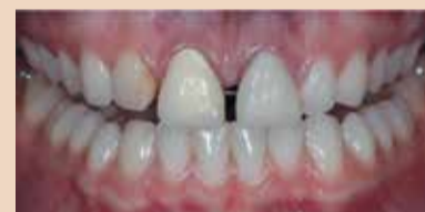
Εικ. 1 Αρχική κατάσταση με MK στεφάνες και διαστήματα.

Το χαμόγελο βασίζεται μόνο στα χείλη, αλλά το γέλιο έχει την θέση του και τη χάρη του ανάλογα με τα δόντια, σημείωσε ο Γάλλος λόγιος J.Joubert το δέκατο ένατο αιώνα. Η οδοντική μορφολογία, η επιφανειακή υφή, η αλληλεπίδραση χρώματος και φωτός, καθώς και η θέση του δοντιού, επηρεάζουν αποφασιστικά το γέλιο ενός ανθρώπου. Ωστόσο, για την αποκατάσταση της αισθητικής ζώνης, η γραμμή του χαμόγελου και το ουλικό όριο θα πρέπει να ληφθούν υπόψη στο σχέδιο θεραπείας προκειμένου να ολοκληρωθεί το χαμόγελο ενός ασθενή. Συχνά, λίγα χιλιοστά καθορίζουν αν κάτι θεωρείται αισθητικό ή όχι.