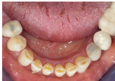
Afbeelding 1. Chemische slijtage als gevolg van zuurinwerking: incisale grooving in het onderfrontsextant.

Het diagnosticeren van gebitslijtage is moeilijk en veeleisend voor de zorgverlener, zowel voor de tandarts als voor de mondhygiënist. Het vereist een allesomvattende benadering. De eerste belangrijke stap is het vastleggen van de ernst van de gebitslijtage door er een cijfer aan te geven oftewel het kwantificeren van de waargenomen gebitslijtage. Hiervoor is gedegen kennis van de oorspronkelijke tandmorfologie een vereiste. Voor het kwantificeren van gebitslijtage zijn diverse indirecte technieken mogelijk, waarbij bijvoorbeeld gebruik kan worden gemaakt van scanners, lasers en elektronenmicroscopie. Hoe nauwkeurig en betrouwbaar dergelijke technieken ook mogen zijn, ze zijn (nog) niet toepasbaar voor dagelijks klinisch gebruik. Uiteraard leveren ze wel een bijdrage aan het verbeteren van de kennis over het slijtageproces. Wellicht krijgen de tandarts en de mondhygiënist in de (nabije) toekomst wel de beschikking over chairside diagnostische hulpmiddelen om gebitslijtage nauwkeurig te kwantificeren, waarbij gedacht moet worden aan digitale