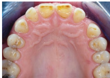
Afbeelding 2. Chemische slijtage door zuurinwerking: occlusale cupping in de premolaren en molaren.

mondscanners. Voor het intraoraal kwantificeren van gebitslijtage zijn er vele indices.