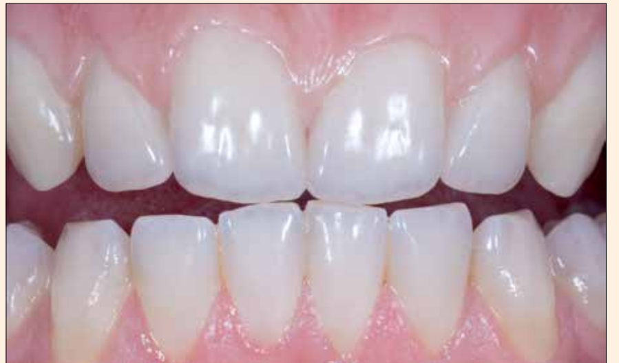
Restauración con zirconia Prettau® 2 Dispersive®: zirconia policromática con colores naturales difuminados, diseño monolítico, estratificado sólo en la zona gingival. Una muestra de la alta calidad de las restauraciones con estas prótesis monolíticas.

de resistencia a la flexión es decisivo para la elaboración de una restauración de una arcada completa desde el punto de vista funcional. Para la elaboración del caso cuyas imágenes se muestran, se decidió utilizar la nueva zirconia Prettau® 2 Dispersive®, un material que combina excepcional resistencia a la flexión con una muy alta translucidez. Esta zirconia ha logrado combinar sus excelentes propiedades funcionales y estéticas, que permiten el diseño monolítico de las restauraciones y evita las fracturas de la cerámica (chipping).