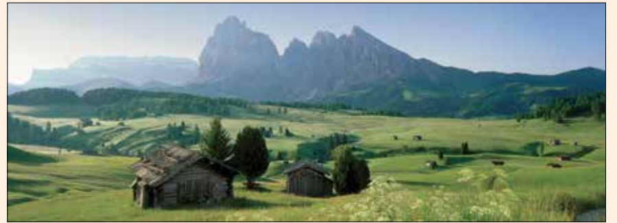
El paisaje de Tirol del Sur, Italia, es la inspiración de Enrico Steger, quien afirma que en su tierra se conjuga el amor por la tradición con el orgullo por el trabajo bien hecho.

Sin embargo, no todos los tipos de zirconia son iguales, diferenciándose especialmente en términos de translucidez y resistencia. Dependiendo de la restauración requerida, se debe seleccionar el material con la mejor combinación de propiedades. Además de las características estéticas, el nivel