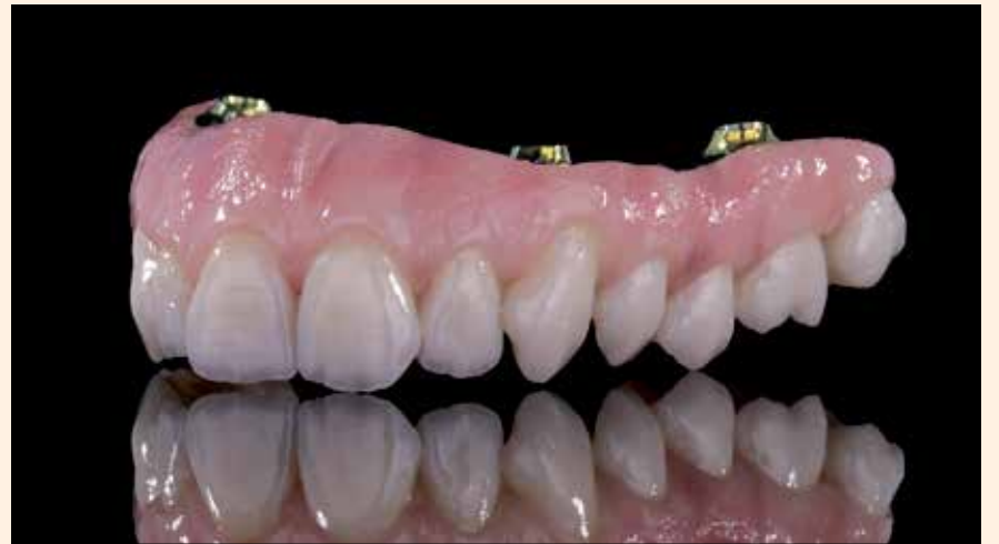
Puente Prettau® hecho con Prettau® 2 Dispersive® (Foto: Education Center Brunico).