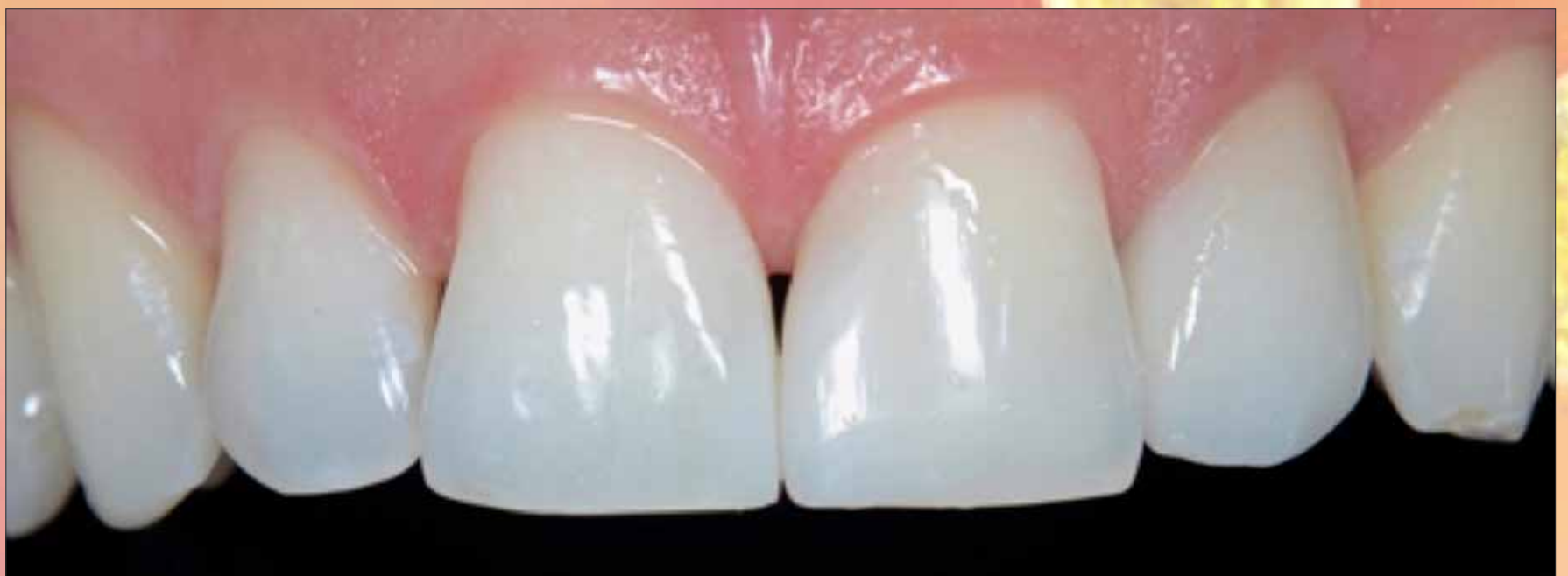
Caso finalizado: las ventajas ópticas de las nuevas resinas son evidentes. Página 20