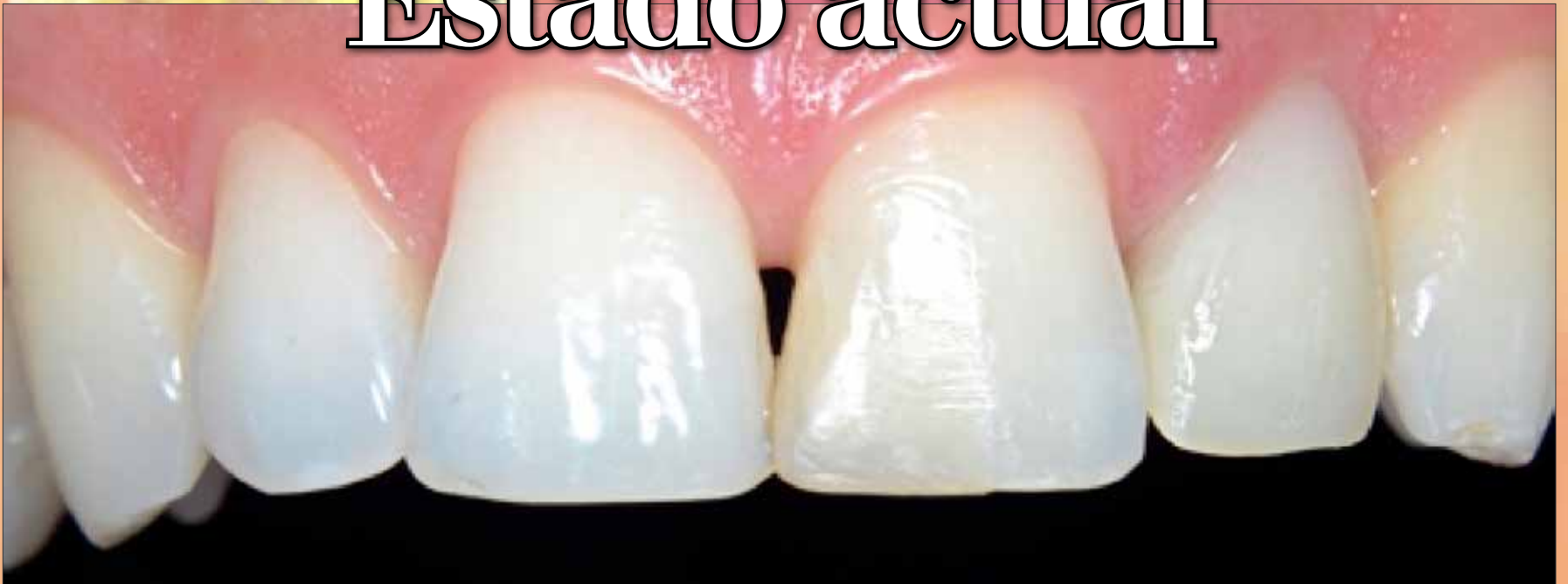
Caso inicial. Restauración en el sector anterior con modificación cromática.