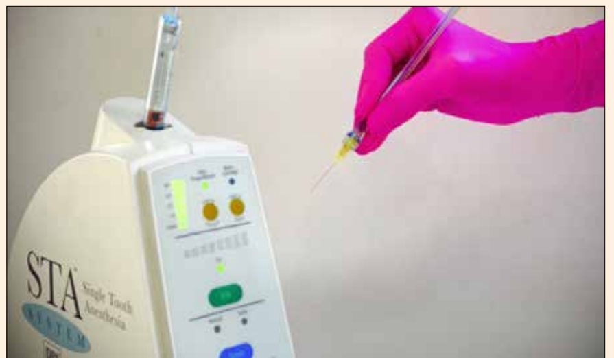
Algunos sistemas de anestesia digital tienen un sonido musical, que hace que los pacientes se relajen y sientan un estímulo diferente al pinchazo.

Debemos tener en cuenta que el odontólogo debe procurar generar menos estrés al paciente en el momento de la inyección del anestésico, el simple hecho de que el paciente vea una aguja, le aumenta los niveles de cortisol, haciendo en muchos casos que el anestésico no actúe eficazmente. En estas situaciones la anestesia digital puede funcionar mejor, ya que estos sistemas son más pequeños, aparentemente producen menos trauma visual, utilizan agujas más delgadas que una jeringa con-