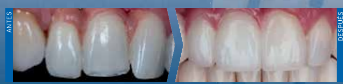
Miles Reed Cone DMD MS CDT FACP, Nuance Dental Specialists, Estados Unidos

Restauraciones en la región anterior requieren materiales de alto valor estético. En particular, las propiedades ópticas son de gran importancia. Zolid HT+ combina de forma única una estética excepcional con elevadas propiedades mecánicas de forma que incluso las estructuras masivas emiten la vitalidad de la sustancia dental natural. Para una excelencia constante en los resultados.