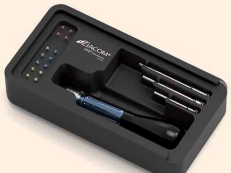
El elegante kit del sistema de microimplantes DSQ-Ziacom.