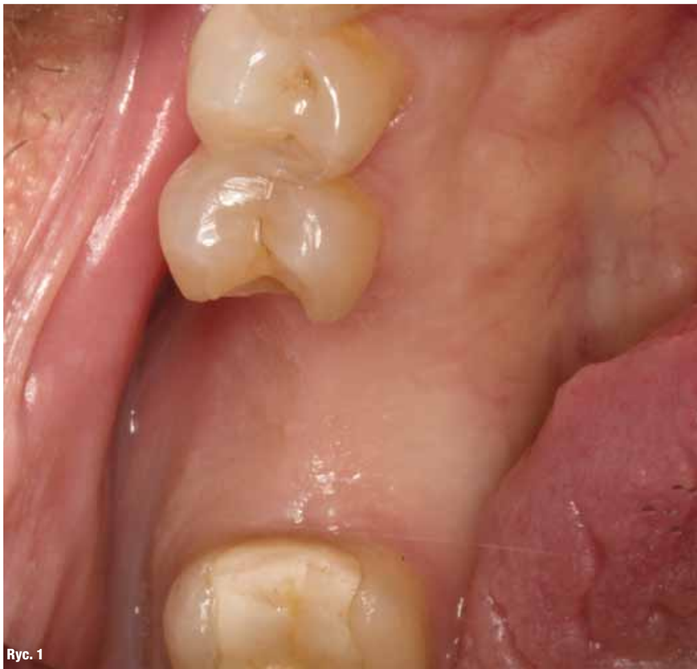
Ryc. 1 _Stan przed przystąpieniem do zabiegu chirurgicznego.