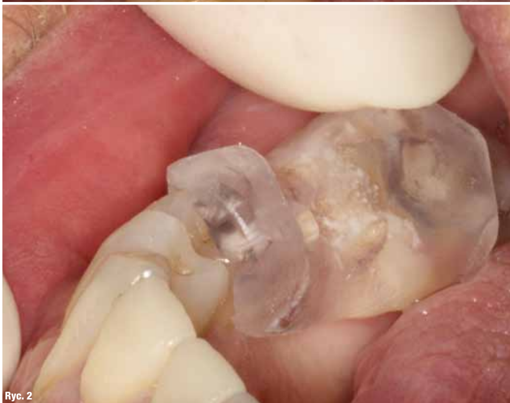
Ryc. 2 _Przymiarka szablonu opartego na zębach własnych pacjenta.