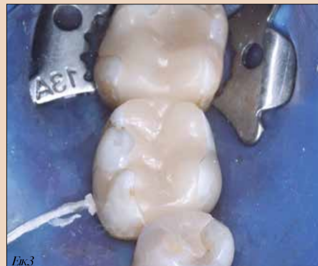
Εικ3. Δοκιμή των ενθέτων.