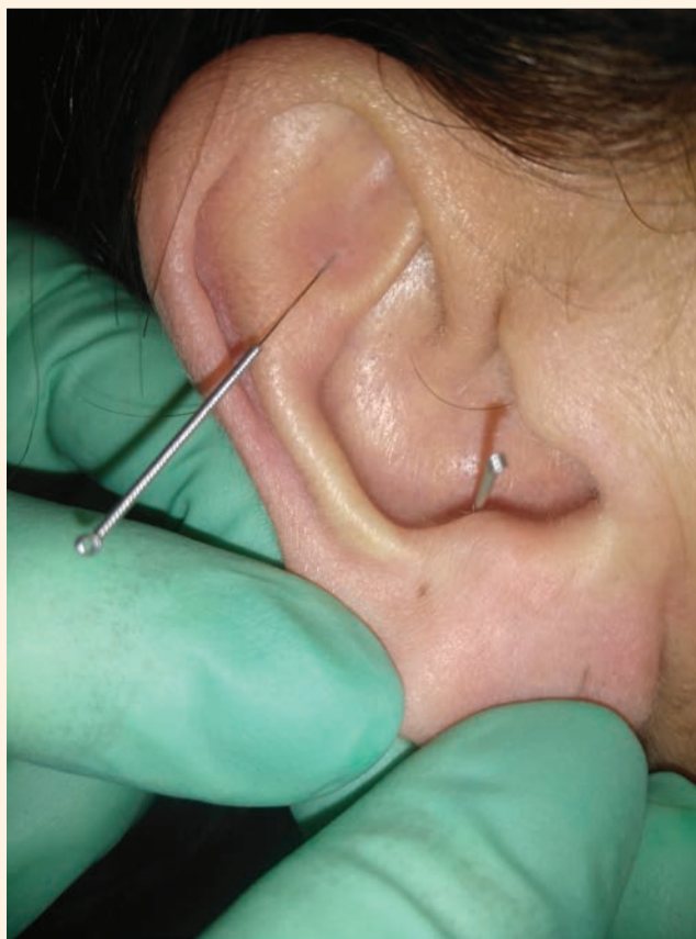
Fig. 1 - Inserimento degli aghi in regioni del padiglione auricolare.