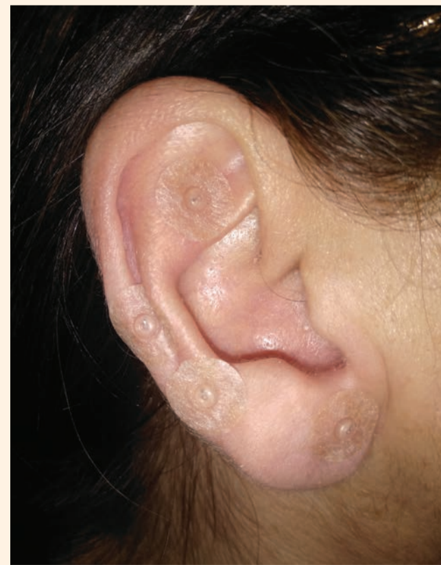
Fig. 2 - Cerotti con mini aghi incorporati, per la stimolazione dei punti di interesse domiciliare.