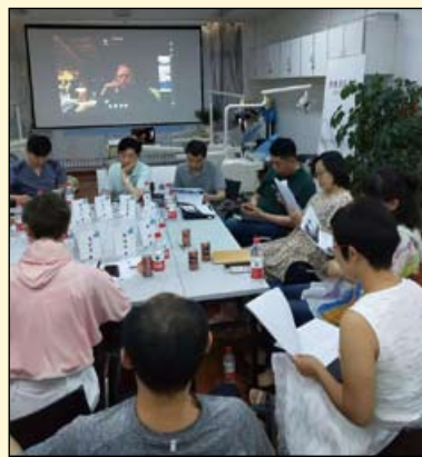
2018年7月某一分会学习场景