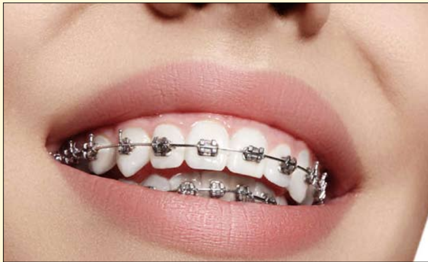
2015年的一项整合分析显示, 有将近70%的正畸患者受到蛀牙的困扰。

玛丽皇后学院牙科物理学院的罗伯特·希尔教授也参与了这项研究, 他表示: “这是一项将会惠及所有正畸患者的巨大突破。我们开发百奥明牙膏时研发出了百奥明技术, 而我们现在进行的这项研究就是该技术的延伸。这种粘合剂能够防止托槽周围那些看不见的白斑的形成。”