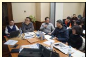
沈阳分会分组学习场景

首次尝试被称为Seattle Study Club的灵魂与精髓“多学科治疗计划制定”, 体验分享互动式学习。