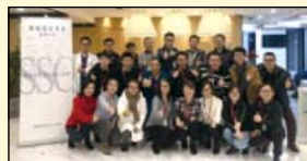
杭州分会的全体合影