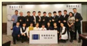
哈尔滨分会的全体合影