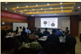
西安分会分组学习场景