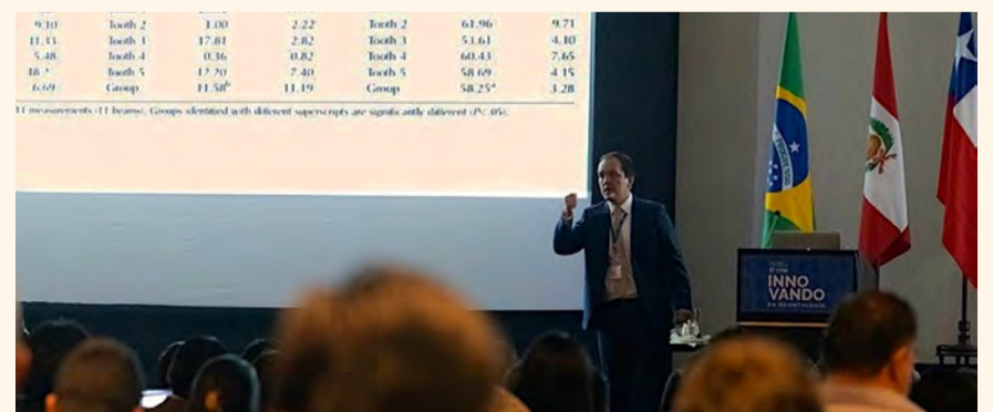
El experto peruano dando una conferencia sobre la importancia de la Adhesión.