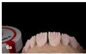
Slika 6a, 6b in 6c: Mikroslojenje s SQIN. Uporabili smo odtenke Dentin Body-A, Translucent TO in Enamel E-58.