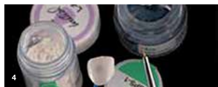
Slika 4: Na prevleke smo nanegli Lustre Pastes ONE (L-6: Enamel Effect 6 Dark Blue) s Spectrum Stains (SPS-1: Ivory White).