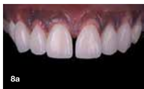
Slika 8a, 8b in 8c: Končni rezultat z restavracijo, zalepljeno na zobe. Slika 8a: Intraoralni frontální pogled. Slika 8b: Intraoralni stranski pogled. Slika 8c: Ekstraoralni pogled.