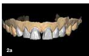
Slika 2a: Digitalni model prepariranih zob. Slika 2b: Digitalni model provizorija.