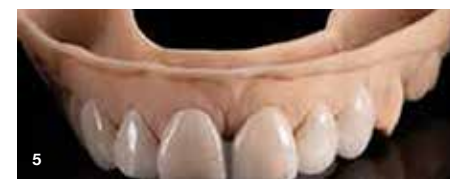
Slika 5: Restavracije po prvem pečenju z Lustre Pastes ONE. Ta peka služi tudi kot povezovalna peka.