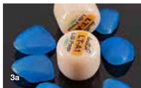
Slika 3a: Prevlake, rezkane iz voska okrog ingota za prešanje (Initial LiSi Press, GC). Slika 3b: Voščene prevleke na modelu. Slika 3c: Prešane prevleke (Initial LiSi Press) po korekciji cervicalnih margin in površinski obdelavi (brušenje in peskanje).