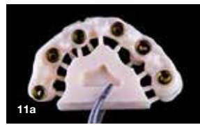
Slika 11a, 11b in 11c: Restavracije iz cirkona, vključno z gingivalno protezo. Slika 11a: Rezkana struktura z nameščenimi prenosniki Ti. Slika 11b: Frontalni pogled sintranega ogrodja. Slika 11c: Po mikroslojenju z ONE SQIN.