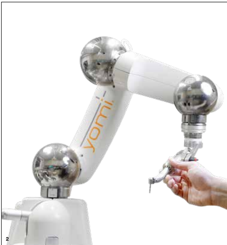
Slika 2: Robotična tehnologija Yomi spreobrača implantološko kirurgijo s povečano klinično natančnostjo in učinkovitostjo.