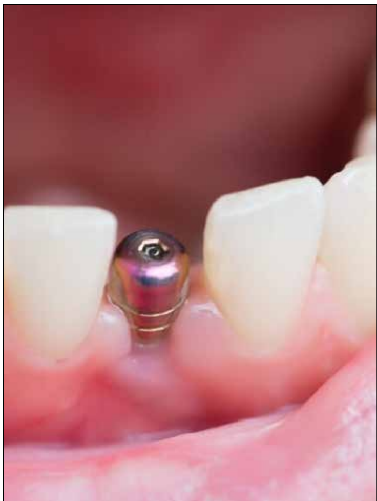
Ne glede na uporabljeni protokol dekontaminacije noben standardni protokol ne zagotavlja varnosti ponovne uporabe prenosnikov pri naslednjem pacientu.

Študija z naslovom "Are healing abutments being reused in periodontics residency programs in the United States? A survey-based study", je bila objavljena na spletu 4. julija 2024 v reviji Journal of Dental Education , pred izidom tiskane izdaje.