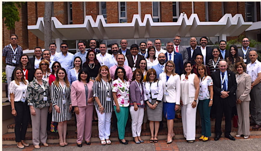
Los decanos que integran OFEDO-UDUAL durante la pasada reunión en República Dominicana.

Los diferentes postgrados de las universidades afiliadas, tanto estudiantes como docentes, pueden tener acceso a esta movilidad, como también el intercambio de académicos por tiempo definido para impartir clases de forma presencial o virtual. Como experiencia propia de nuestra facultad, nueve docentes nuestros han realizado postgrados y maestrías en universidades afiliadas a OFEDO en tiempos recientes