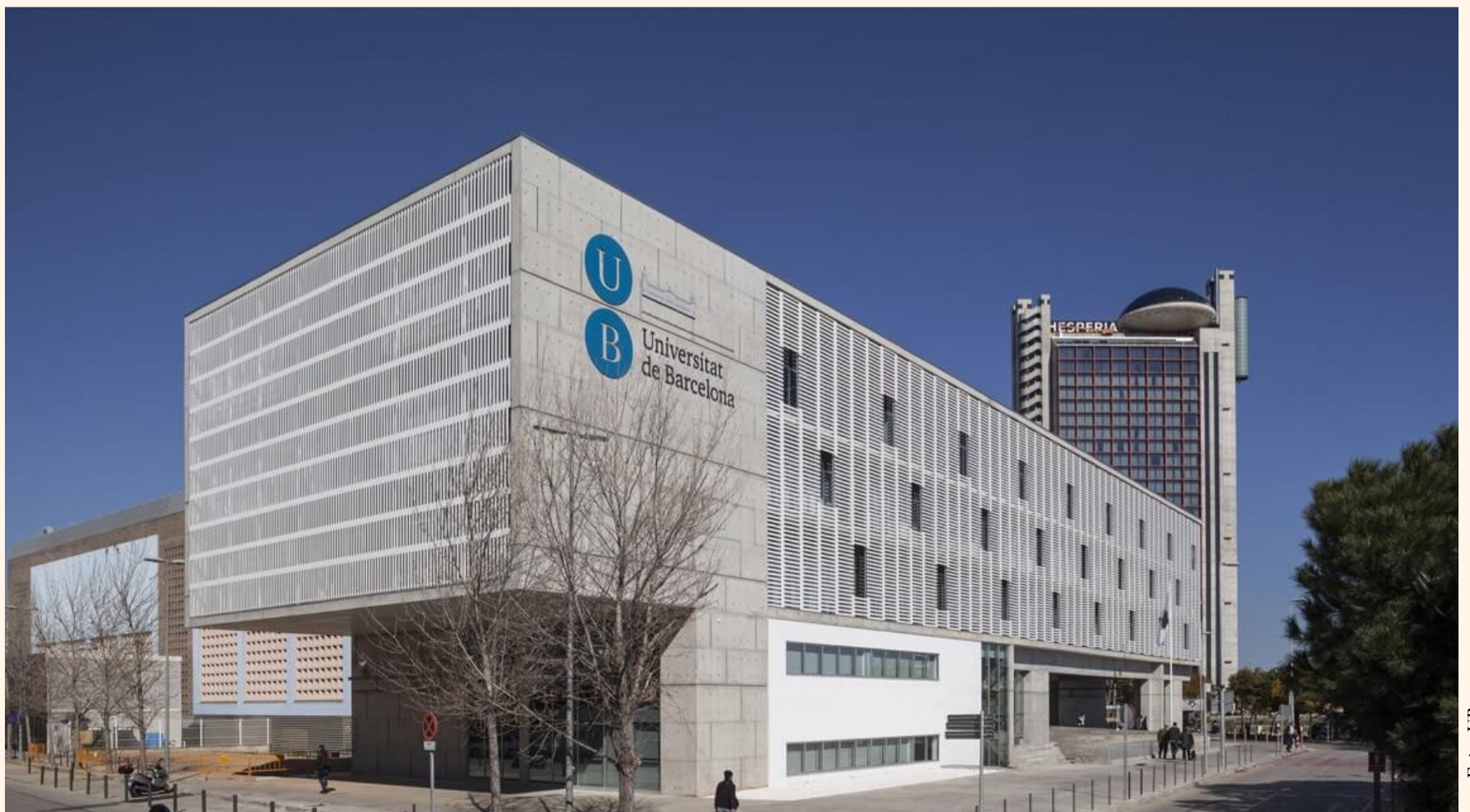
El edificio de la Facultad Odontología de la Universidad de Barcelona.