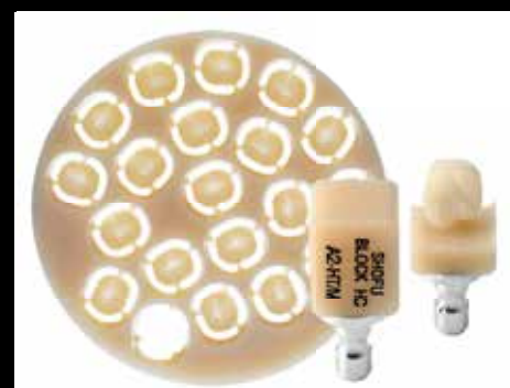
RESTAURADOR CON BASE CERÁMICA