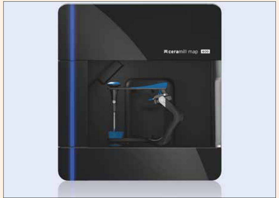
El escáner Ceramill Map 600 ofrece una rapidez insuperable.

El escáner de 5 ejes Ceramill Map 600 permite escanear los modelos articulados directamente en el articulador, sin pasarlos previamente a