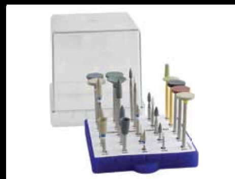
CONTORNO, ACABADO Y PULIDO