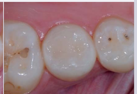
*Restauration terminée avec adaptation chromatique.

Nanofill unique est un nouveau composite microhybride à nanocharges pour restaurations directes et indirectes antérieures et postérieures.