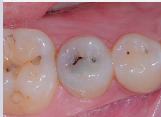
*Cavité occlusale avec large perte de substance.