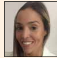
Por Carolina Bechara

tificar la razón de nuestro miedo, qué nos da ansiedad del dentista. Una vez identificado el problema, debemos elegir una clínica y un profesional que nos inspire confianza, podemos preguntarle a familiares y amigos sobre alguno al que hayan asistido. Si no sienten conexión con el profesional, es mejor elegir otro, pues no superaremos la barrera del miedo si no nos sentimos cómodos con él. Ya elegido el lugar y el dentista, debemos pedir cita con hora, para vernos obligados a asistir y no tener la posibilidad para arrepentirnos. Antes de asistir a la consulta, es necesario prepararnos mentalmente, realizar actividades que nos relajen, evi-