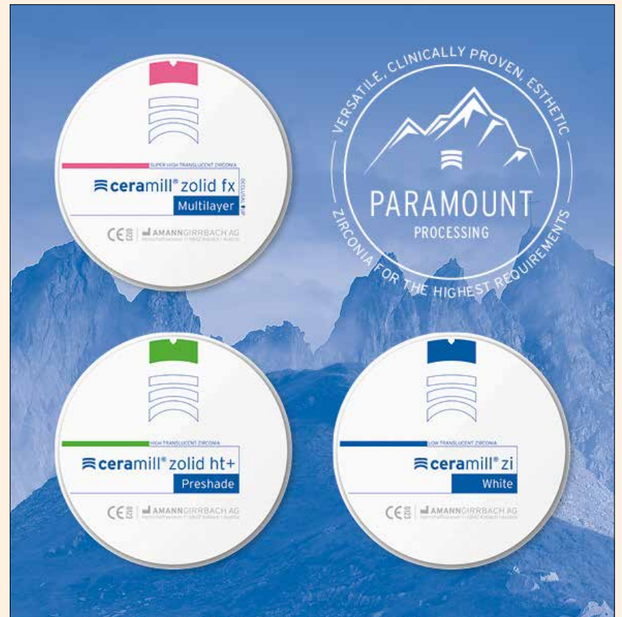
El procesador de óxido de circonio Paramount Processing y los tres colores de restauración a base de este material de la línea Ceramill.

Los expertos de Amann Girrbach miden una docena de propiedades más. Entre ellas, el color y la fresabilidad, la calidad de la superficie y el comportamiento en la tinción, la translucidez y el desgaste de las herramientas. Gracias a este procedimiento optimizado de Paramount Processing, los usuarios de Zolid DNA pueden