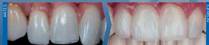
Myles Reed Cone DMD MS CDT FACP, Nuance Dental Specialists, Estados Unidos

Restauraciones en la región anterior requieren materiales de alto valor estético. En particular, las propiedades ópticas son de gran importancia. Zolid HT+ combina de forma única una estética excepcional con elevadas propiedades mecánicas de forma que incluso las estructuras masivas emiten la vitalidad de la sustancia dental natural. Para una excelencia constante en los resultados.