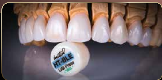
Restauraciones: Cortesía de Bill Marais, RDT & Rick Canizares, DMD

G-CEM LinkForce™ cemento de resina optimizado para ser utilizado con GC Initial™ LiSi Press