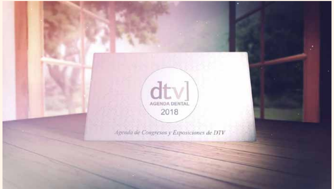
El nuevo programa «Agenda Dental», muestra toda la información de los principales eventos odontológicos en todo el mundo.

©2018 Dental Tribune International. All rights reserved.