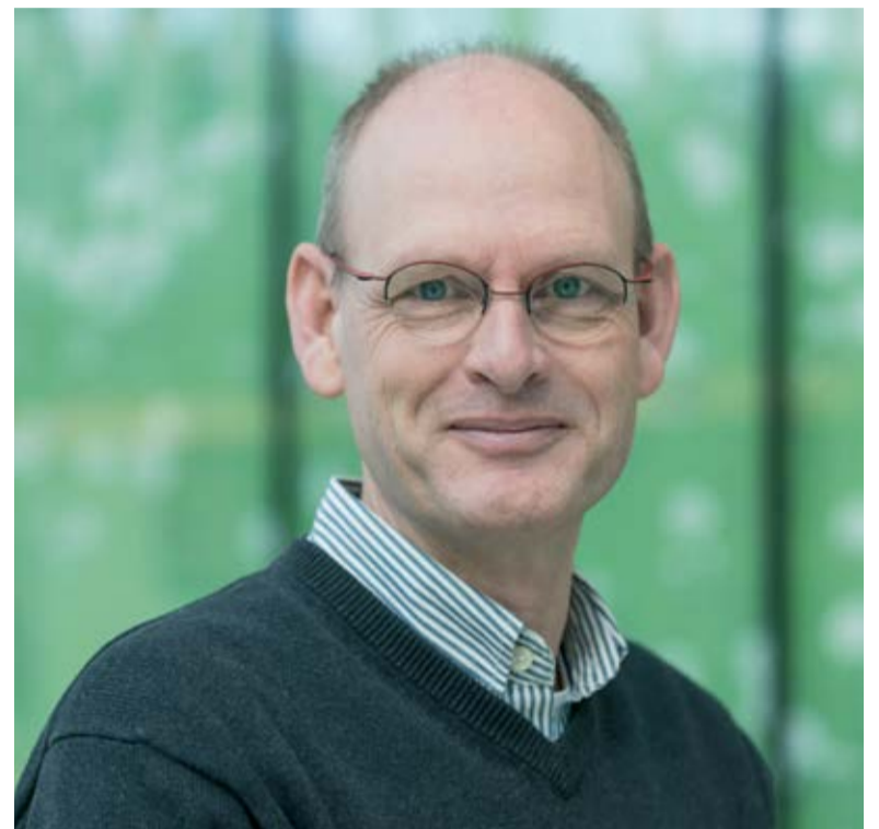
Prof. dr. Fridus van der Weijden.

Van der Weijden: Een van de dingen was dat je op basis van de DPSI een soort diagnose aan de patiënt hing. Dat is een gedachtekronkel waar ik mijzelf ook schuldig aan heb gemaakt. Neem bijvoorbeeld iemand met één pocket van 6 mm. Die kreeg een DPSI-score van 4, terwijl iemand met 32 gebitselementen met rondom pockets van 4-5 mm een DPSI-score van 3 kreeg. Die hoogte van de score suggereert dat de eerste casus ernstiger is dan de tweede, maar als je er als clinicus naar kijkt, vraagt de casus met meerdere pockets van 4-5 mm veel meer zorg en aandacht. Je kunt dus niet een parodontale diagnose aan één indexgetal ophangen. Daar is verder onderzoek voor nodig. Met