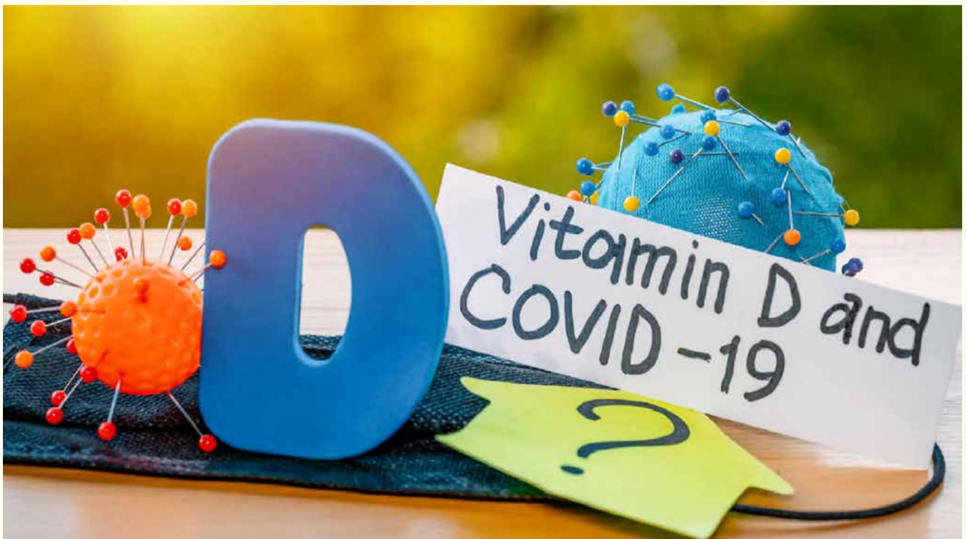
Vitamin D bi mogao pomoći u liječenju COVID-a-19.

Vitamin D je steroidni hormon koji se unosi putem ishrane ili sintetizira u kožu putem holesterola onda kada je koža adekvatno izložena suncu (osnovni izvor za unos vitamina D). Nažalost, izloženost direktnoj sunčevoj svjetlosti je dramatično smanjena u današnjem društvu sa povećanim brojem kancelarijskih poslova. Stoga, kako starimo, smanjuje se naša sposobnost da apsorbuje vitamin D. Nedostatak vitamina D je svjetski problem javnog zdravstva koji pogađa sve starosne skupine. Studija koja je nedavno sprovedena je pokazala da oko 70% društva ima nedostatak vitamina D. 1