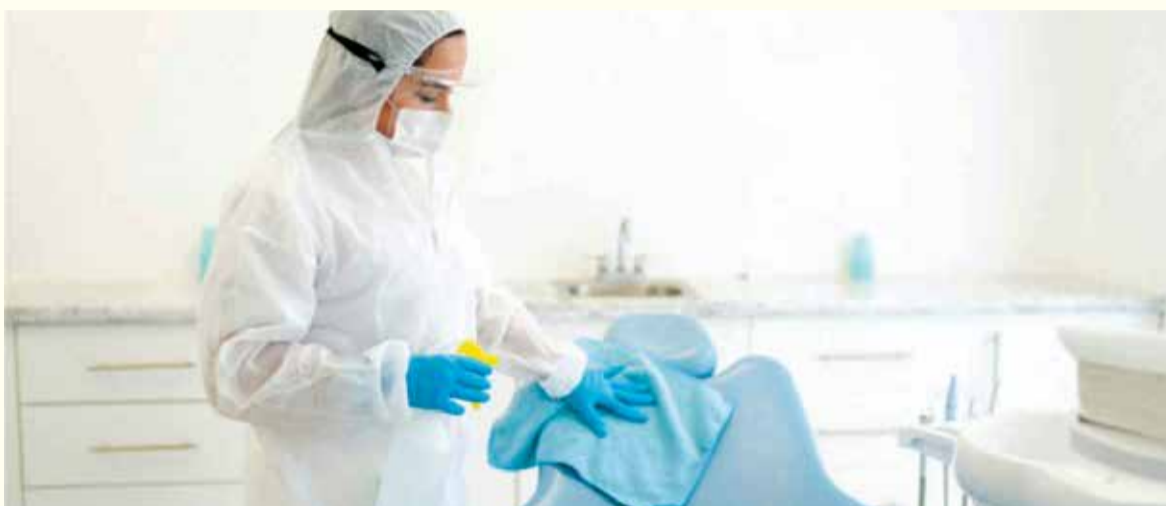
Prema informacijama nedavno objavljenim u jednom preglednom članku, posljedice COVID-a-19 na stomatološke ordinacije će, najvjerovatnije, biti dugoročne.

„Hiljade stomatologa, higijeničara i drugog stomatološkog osoblja širom svijeta su iskusili iznenadni, do sada nezabilježen, prekid rada u pružanju oralne zdravstvene brige. Veliki broj stomatologa nastoji shvatiti nauku koja se krije iza uputa za povratak na posao koje im se trenutno serviraju kao i potencijalne uticaje pandemije na stomatološke ordinacije u budućnosti,“ rekao je vodeći autor istraživanja dr. Carl McMillan, predsjednik IAOMT-a, na press-konferenciji na Akademiji. Pregledni članak koji je uključio ispitivanje više od 90 članaka naučnih časopisa pokazao je da je kontrola infekcije u stomatologiji bila najznačajnija tema koja se pojavljivala u naučnim člancima. Opće preporuke za ublažavanje rizika od zaraze, uključujući i skrining pacijenata kao i nošenje lične zaštitne opreme, su klasificirane u jasne potkategorije, poput pitanja o