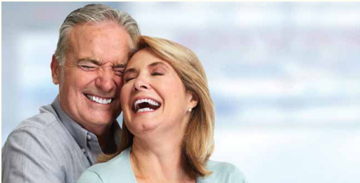
Qunomedical piše: Zdravlje zuba i pristupačna dentalna briga su samo dva od niza odlučujućih faktora koji se kriju iza zdravog osmijeha.

BERLIN, Njemačka: Istraživanje sprovedeno u evropskim državama je otkrilo da ljudi u Italiji, Njemačkoj i Španiji imaju najbolje dentalno zdravlje u Evropi. Ove tri države su se našle u vrhu indeksa sačinjenog putem digitalne medicinske platforme Qunomedical preko koje se ocjenjivalo zdravlje zuba evropske populacije kao i faktori životnog okruženja i način života koji utiču na zdravlje zuba.