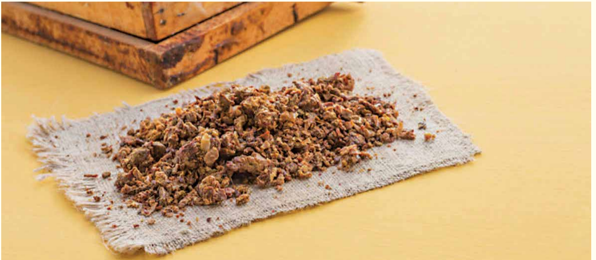
Propolis je jedinjenje koje proizvode pčele i za koje se smatra da je dobar u borbi protiv infekcija, da liječi rane i još mnogo toga. Ovaj materijal je pokazao dobre kliničke rezultate kada se pomiješa sa cink oksidom i može se uzeti u obzir kao alternativa za punjenje kanala korijena mliječnih zuba. (Slika: Auhustsunovich/Shutterstock)

ANDHRA PRADESH, Indija: Uspjeh pulpektomije zavisi od eliminacije bakterija iz kanala korijena zuba. Istraživači su sada eksperimentirali sa novom mješavinom koja se sastoji od propolisa, prirodnog proizvoda sa dokazanim antibakterijskim i protuupalnim svojstvima, i cink-oxid praha kao materijala za punjenje kanala korijena mliječnih zuba.