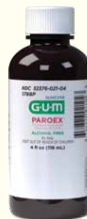
Proizvod o kojem se govori. (Slika: Sunstar Americas)

u datume od 31. decembra 2020. do 30. septembra 2022. godine. Prema informacijama iz Sunstar Americas, moguće je da je proizvod kontaminiran bakterijom Burkholderia lata . I dok bi ovo moglo dovesti do „oralne i, moguće, sistematske infekcije