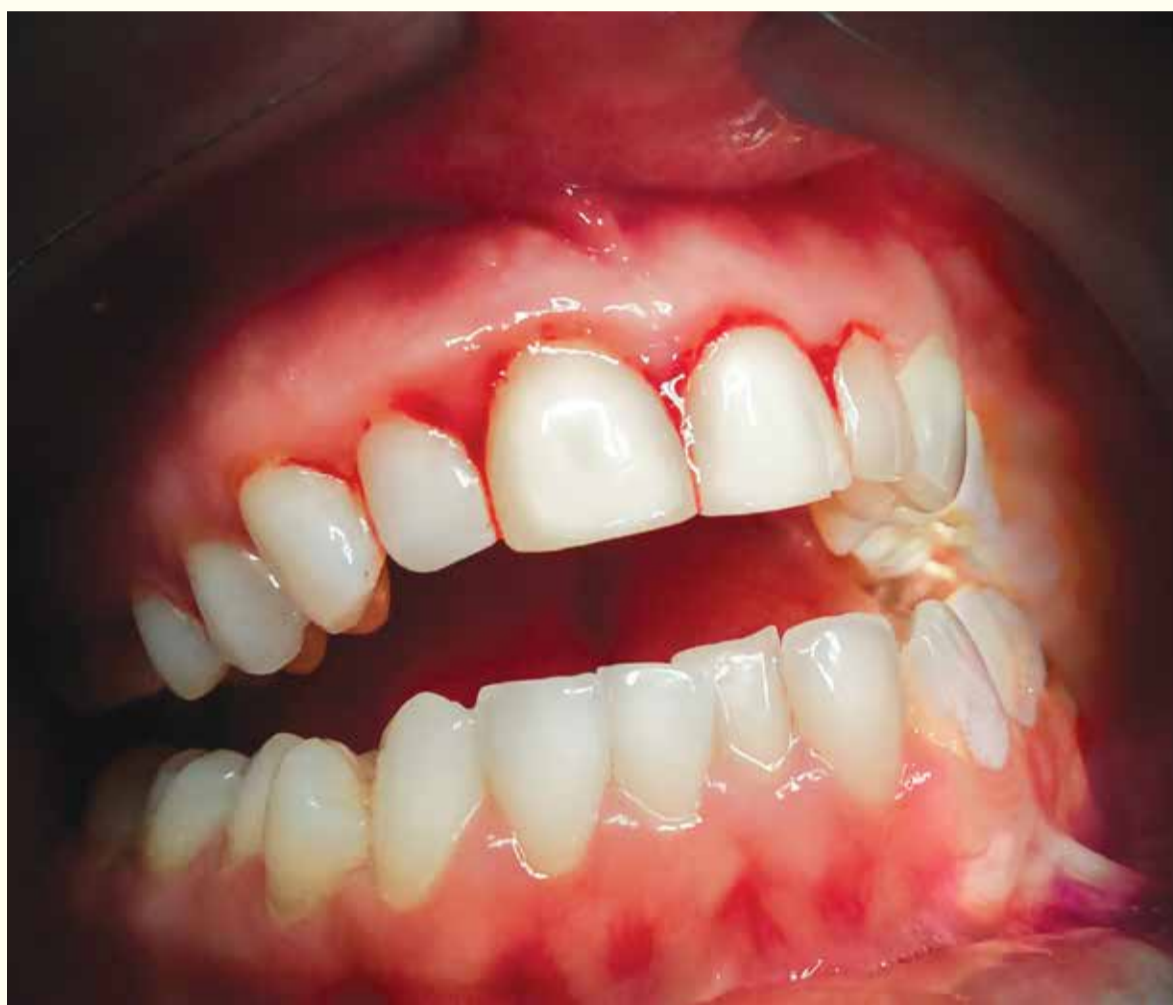
Hronična bolest bubrega se javlja kod 8 - 16%, a paradentozа preko 7% svjetskog stanovništva.

Prethodno je utvrđeno da oksidativni stres uzrokuje uzajamnu povezanost u oba pravca, suprotno uobičajenom vjerovanju da je upalna reakcija veza između paradentozе i drugih sistematskih bolesti. Oksidativni stres je disbalans između tjelesnih slobodnih radikala koji proizvode oksigen i njihovih antioksidanskih kapaciteta što narušava tkivo na ćelijskom nivou.