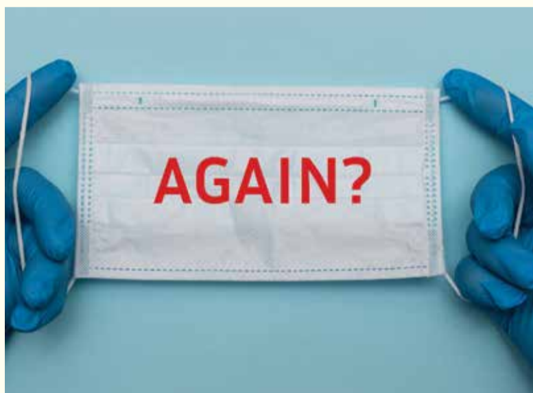
Nedavno sprovedena studija pokazala je da su ljudi koji su se oporavili od COVID-a-19 razvili samo kratkotrajni imunitet na SARS-CoV-2.

HARLOW, UK: Veliki broj pitanja koji se odnose COVID-19, uključujući simptome, rizike i period oporavka, je već odgovoren. Međutim, istraživači su se suočili s novom dilemom: reinfekcija SARS-CoV-2 virusom i imunitet. Iako je neobično, evidentno je da se slučajevi reinfekcije javljaju, a u nedavno obavljenoj studiji istraživači su ispitali da li su pojedinci koji su se oporavili od COVID-a-19 zaštićeni od zaraze u budućnosti. Rezultati ukazuju na to da prethodne infekcije mogu obezbijediti prirodni imunitet te da je spomenuti imunitet efikasan u prosjeku pola godine nakon prvobitne infekcije.