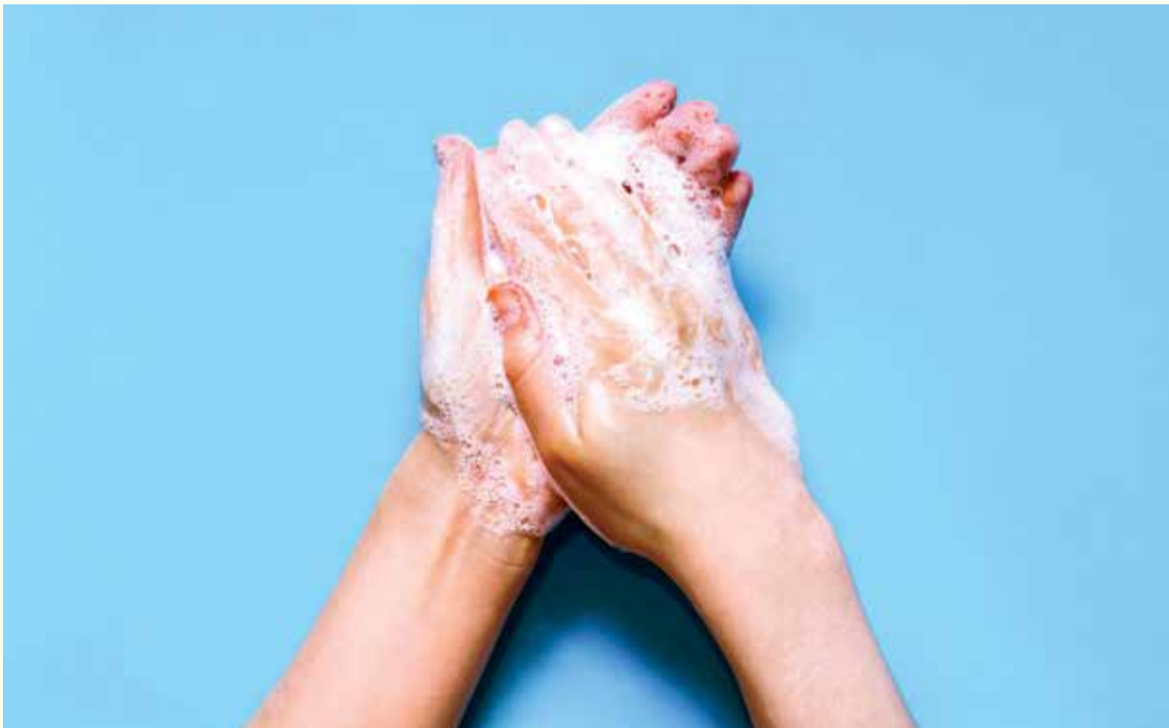
U vremenu virusne epidemije kao što je ova izazvana virusom COVID-19, ciklodekstrini mogu imati značajnu ulogu u prevenciji i kontroli virusa u stomatološkim ordinacijama.

Tijekom virusne epidemije izazovi postavljeni pred stomatološke ordinacije su značajni. Pojavljuju se zahtjevi za ekstremnom higijenom i prevencijom širenja virusa, a ciklodekstrini u proizvodima za oralnu njegu mogli bi pomoći dentalnim stručnjacima u obavljanju njihovog posla uz istovremeno očuvanje zdravlja i sigurnosti svih uključenih. Iako nisu prvenstveno namijenjeni za prevenciju ili liječenje virusnih infekcija, baš kao i sapuni, oni razaraju membranu virusa i na taj način ih oslabljuju.