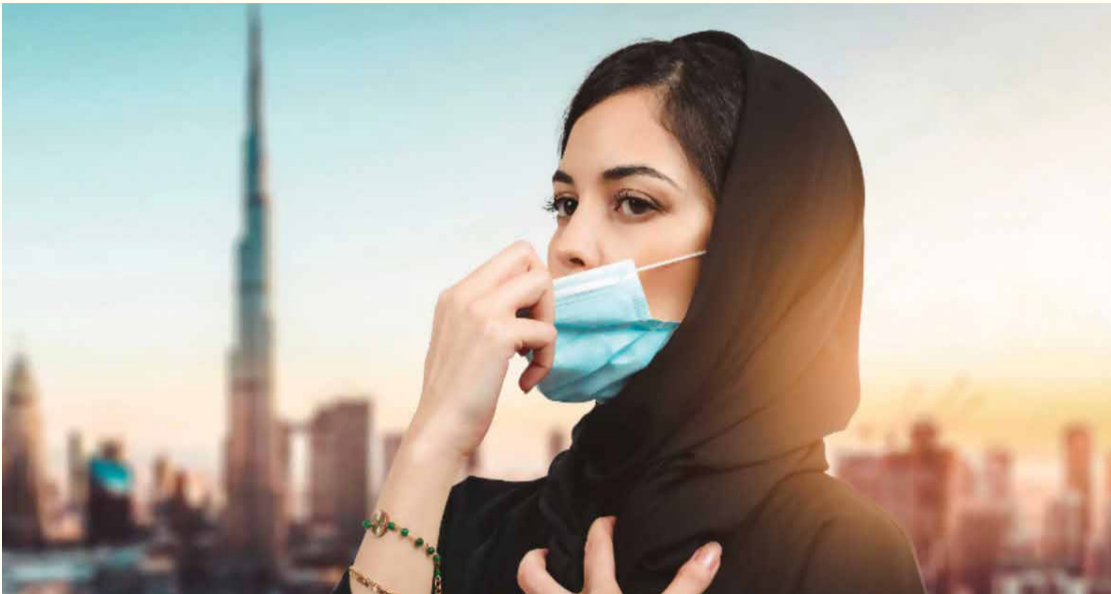
Dubai, popularna turistička destinacija tokom pandemije, je uveo mjere kako bi smanjili broj zaraženih SARS-CoV-2 virusom, uključujući i otkazivanje redovne dentalne brige.

DUBAI, UAE: Dentalni tretmani koji nisu hitni su obustavljeni u emiratima u Dubaiju, najpopularnijem gradu i teritoriji UAE-a. Prema izjavi Zdravstvenog vladajućeg tijela u Dubaiju (engl. DHA), ova mjera predostrožnosti ima cilj zaštititi pacijente i zdravstvene radnike od SARS-CoV-2 te spriječiti širenje virusa.