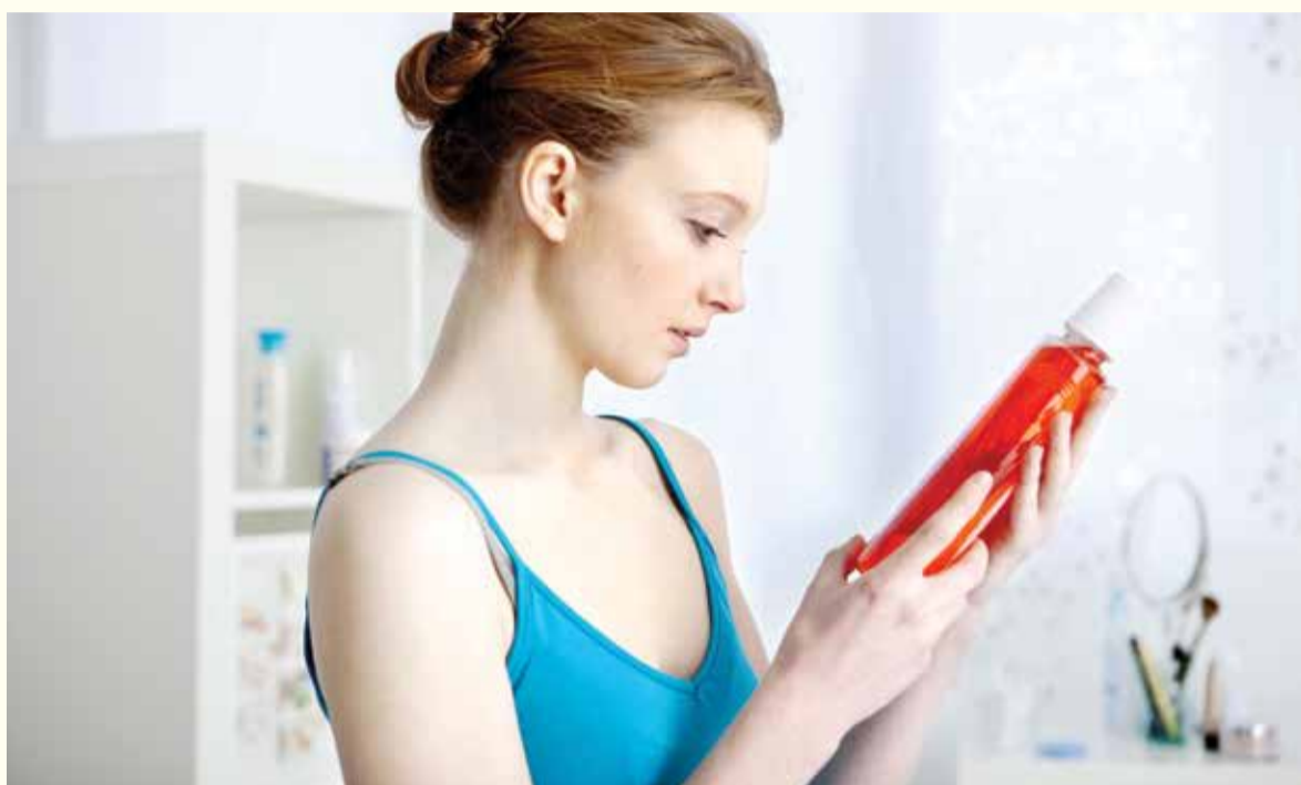
Sunstar Americas je povukla sa tržišta svoja sredstva za ispiranje usta jer njihova upotreba izaziva tešku infekciju.

SCHAUMBURG, Ill., SAD: Sunstar Americas je, krajem mjeseca decembra, svojevlasno povukla sa tržišta jedan od proizvoda za ispiranje usta. Kompanija je član Sunstar grupacije, globalne kompanije sa sjedištem u Švicarskoj, jednim od lidera u industriji oralne brige. Kao razlog za povlačenje proizvoda su naveli bakterijsku kontaminaciju.