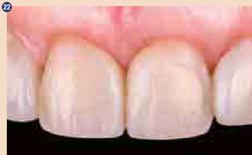
Končne restavracije: frontalni pogled