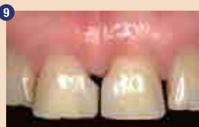
Pred celjenjem je bil gingivalno dodan kompozit.