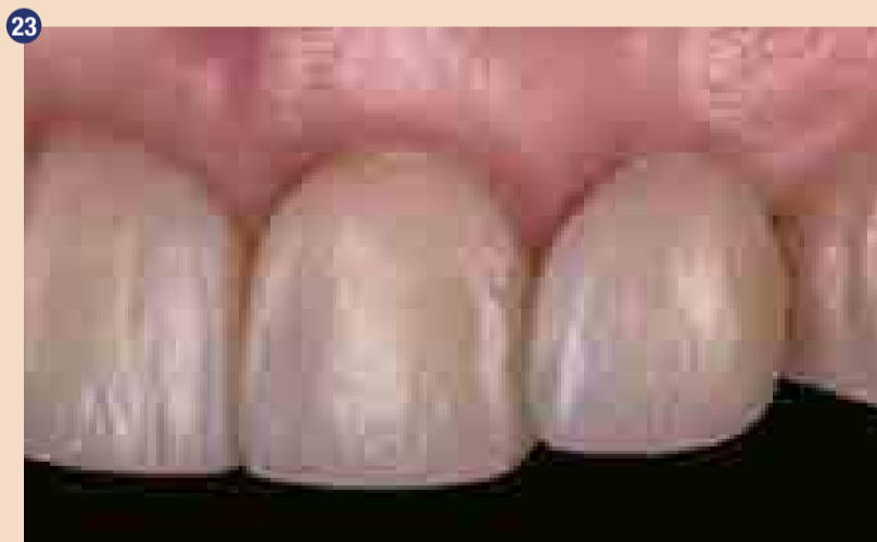
Končne restavracije: lateralni pogled, studijska bliskavica a) pogled iz leve b) pogled iz desne