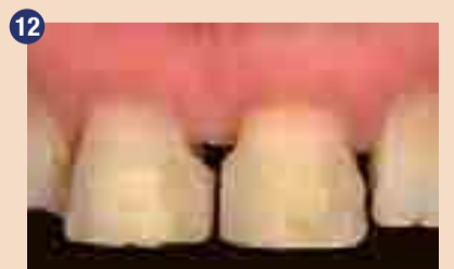
Izolacija z gumijasto opno.