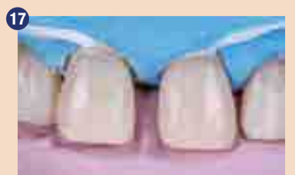
Izdelava palatinalne omarice z Essentia LE