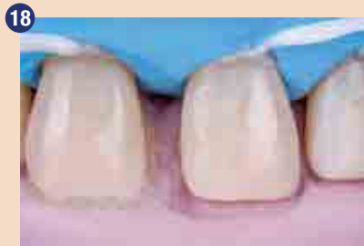
Dentinska stratifikacija z Essentia MD in DD