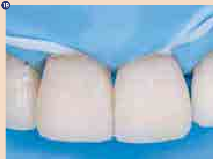
Vestibularna sklenina: Essentia LE