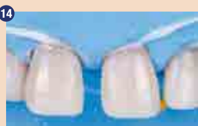
Jedkanje s H3PO4