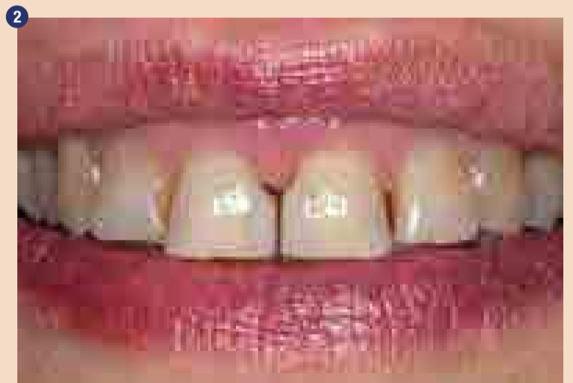
Začetno stanje; Usta v mirni legi