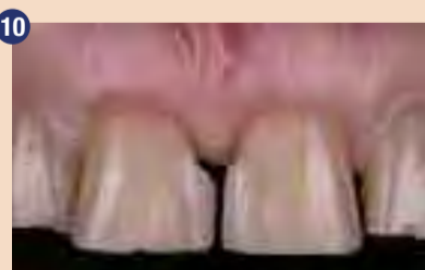
Po enomesečnem obdobju celjenja