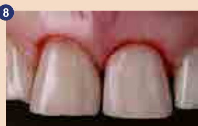
Gingivektomija vodena z mock-up