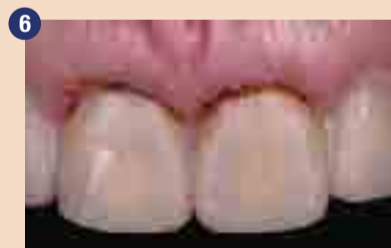
Obris diagnostične modelacije v vosku; distalni koti potrebujejo zaokroženje, manjša gingivektomija bi izboljšala razmerja