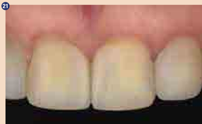
Končne restavracije: polarizirana slika