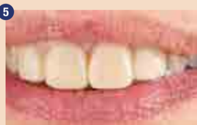
Diagnostična modelacija v vosku