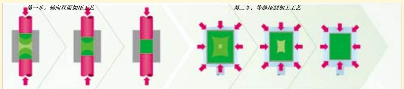
图2: VITA YZ系列氧化锆材料的冲压工艺原理图。

试验方法: 使用计算机辅助切削设备制作7单位长桥, 并按照厂家的标准操作流程进行结晶烧结, 烧结后在切削氧化锆模型上就位。