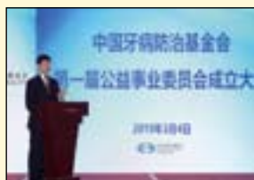
中国牙病防治基金会副理事长、解放军总医院口腔医学中心主任刘洪臣做公益事业委员会报告