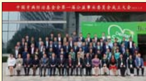
中国牙病防治基金会公益事业委员会委员合影

为集合口腔医学相关领域的社会资源和精英力量，搭建合作共赢的公益平台，经中国牙病防治基金会全体理事会议审议通过，成立公益事业委员会。旨在面向社会，以需求为导向，开展信息技术优化继续教育方式，加大对基层和偏远地区扶植力度，全面提高基层口腔医务人员的能力和技术水平。落实推动和发展口腔医学领域的公益事业，发挥专业资源和人才优势，加强实用型、复合型人才培养培训，引领口腔健康服务业优质发展。推动口腔健康制造业创新升级，推动科技成果转化和适宜技术应用。促进新技术、新材料的应用与推广等等。DT