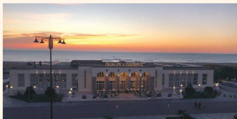
Panorama dal Grand Hotel Principe di Piemonte di Viareggio, sede del Congresso

Altissima la cassa di risonanza avuta dal congresso, che ha visto pubblicazioni in ambito nazionale in tutta Italia, dal Quotidiano di Sicilia al Tirreno, con articoli anche sulla Nazione, in tv e in radio, sin-