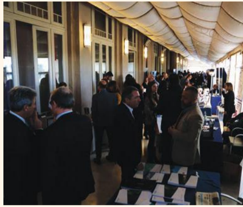
Area sponsor al Congresso di Viareggio