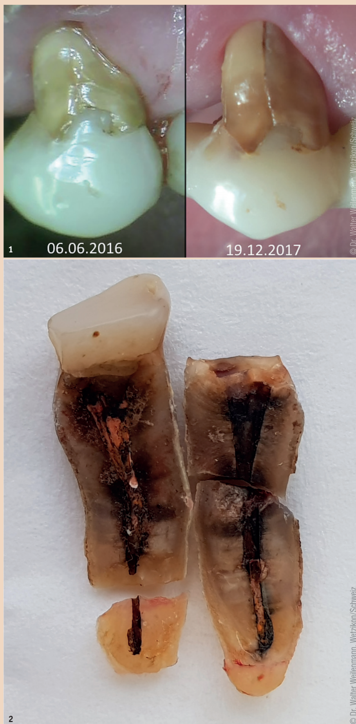
Abb. 1: Entwicklung eines Microcracks zur Vertikalfraktur. – Abb. 2: Degradierete Wurzelkanalfüllung: Ursache oder Folge der Vertikalfraktur?

Ein weiterer entscheidender Faktor neben der Wurzelkanalbehandlung ist die Art der endgültigen Versorgung endodontisch behandelter Zähne, insbesondere der