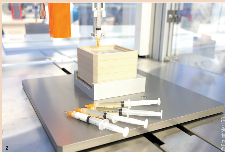
Abb. 2: Spritzen mit verschiedenen Biotinte-Formulierungen.

tine fest wie ein Wackelpudding – so kann sie nicht gedruckt werden. Damit dies nicht passiert und wir sie unabhängig von der Temperatur