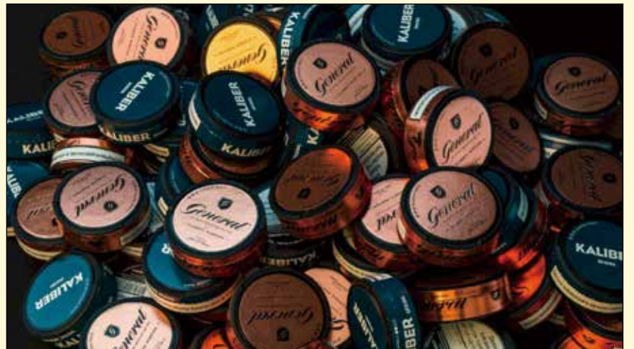
根据美国食品和药物管理局称，从香烟向授权无烟烟草产品的彻底转型可以降低某些口腔疾病和一般健康问题风险。

自1992年以来，除瑞典外，所有欧盟成员国都禁止销售鼻烟。2018年11月，欧盟法院驳回了对该禁令的指控。DT