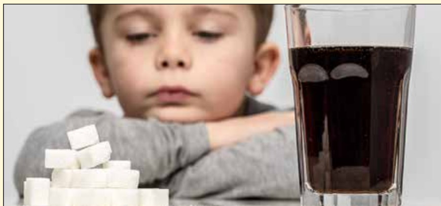
研究人员发现, 在2018年, 甜味饮料占儿童饮料销量的62%。

在这份报告中, 研究人员称, 2018年公司在加糖的儿童饮料广告上花费了2070万美元, 广告主要针对12岁以下的儿童。除了这些广告外, 包装和一些包装上的说明让家长很难知道什么才是健康的选择。“你不是必须成