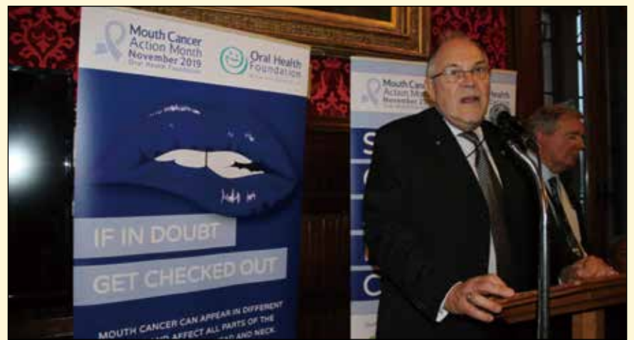
在发起“口腔癌行动月”的活动中，演讲者鼓励进行口腔癌筛查检查，以提高人们对口腔癌的认识，并提高生存率。