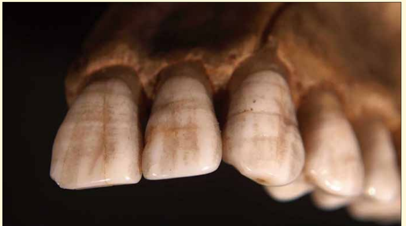
最新研究将儿童时期营养不良和健康状况不佳的牙釉质发育不全作为性别平等评价指标。