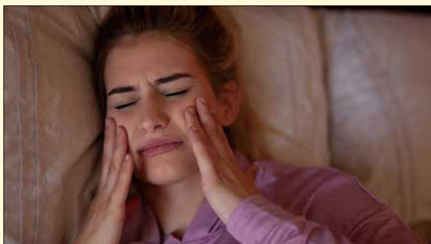
最新研究研发一种廉价设备，患者可居家监测磨牙症。

注病情的管理，科学家认为，多导睡眠描记评估方法的成本过高，不利于对长期疗效的研究。