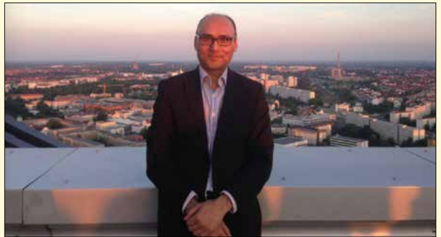
鉴于经常接受牙科X光检查的风险，Anjum Memon教授认为有必要减少牙科诊断系统的射线暴露。。

英国，布莱顿/美国，亚特兰大：全球甲状腺癌和脑膜瘤发病率呈上升趋势。新研究发现，反复进行牙科射线检查可能会增加甲状腺癌、覆盖大脑和脊髓的组织患肿瘤的风险。因此，研究人员得出结论，应该只在患者有特定临床需要时才进行射线检查，而不将其作为常规检查项目。此外，专业人员应保存射线检查记录，避免不必要检查。