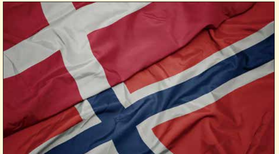
通过扩展DTI网络，多个平台将为挪威的更多牙医提供服务。

个国家的123.5万多名牙医提供服务。通过向丹麦和挪威的扩张，DTI进入了北欧地区一个重要市场。DT