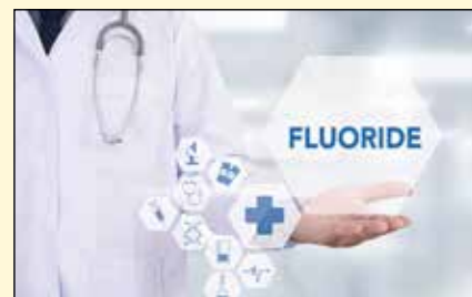
新西兰牙科协会最近呼吁两党采取行动通过一项法案，来赋予地区卫生局关于水氟化更多的控制权。

据比格霍尔称，该法案在议会面前已经无效了一段时间。现在，随着关于《零碳法案》最近获得的成功，他说：“事实上，我们已经可以看到，两党、多党合作对于我们星球的未来是可能的，所以为什么不新西兰牙科健康的未来一起合作呢？” DT