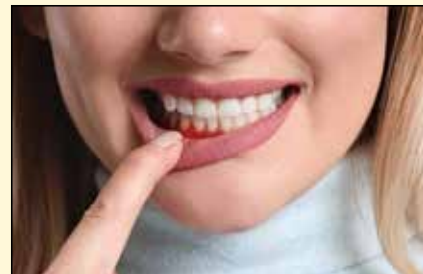
经过几年磋商, 欧洲牙周病联合会向欧盟提出成熟议案以期让牙周病学作为专业学科获得广泛认可。

目前, 欧盟28个成员国中有12个已经认可牙周专业。然而, 据EFP报告, 在一些国家存在来自牙科协会的阻力, 他们担心更多牙科专业认定可能会限制普通牙科医生的执业范围。作为回应, Wilson指出, 在这些认定并规范牙周和其它牙科学分支的国家, 没有哪个牙科协会希望取消专业地位。专业地位具有描述性, 而不是限制性。DT