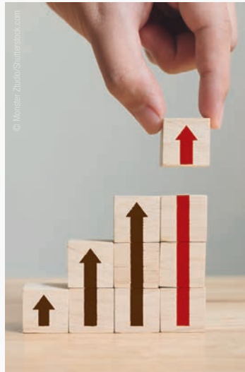
• Durch die Übernahme steigt der Jahresumsatz von Planmeca auf mehr als 1,1 Milliarden Euro. • The acquisition will increase Planmeca's annual revenue to more than €1.1 billion.

„Envista konzentriert sich auf seine strategischen Prioritäten, um ein stärker auf Verbrauchsmaterialien und digitale Arbeitsabläufe ausgerichtetes Portfolio aufzubauen und zu optimieren. Dieser Verkauf wird Envista besser positionieren, um organisch und anorganisch zu investieren und unser Produktangebot in diesen Bereichen zu erweitern“, sagte Envistas CEO, Amir Aghdaei, in einer Pressemitteilung des Unternehmens. Kyöstiä kommentierte die Übernahme in einer Pressemitteilung von Planmeca: „Diese Partnerschaft wird uns zu einem sehr starken Akteur im Dentalbereich machen. Ich glaube, dass unsere Unternehmen hervorragend zusammenpassen - wir teilen die gleichen Standards und Leiden-