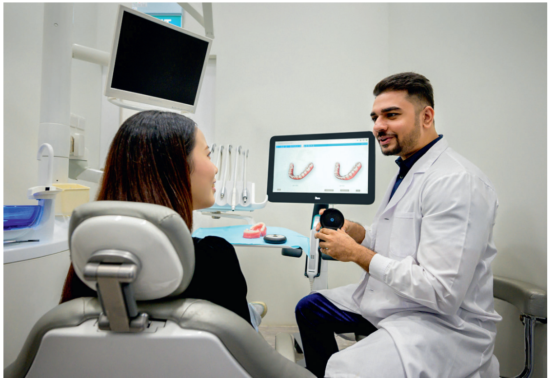
◀ Align Technology entwickelt, produziert und vertreibt das transparente Aligner-System Invisalign. ◀ Align Technology designs, manufactures, and sells the Invisalign clear aligner system.

All IDS 2021 attendees—including dentists, laboratory practitioners and industry partners—will be able to learn about Align's latest innovations, including the Invisalign Go Plus system, the latest addition to the general dentist's portfolio for mild to more complex cases. Attendees can also see how digital workflows are enabled by