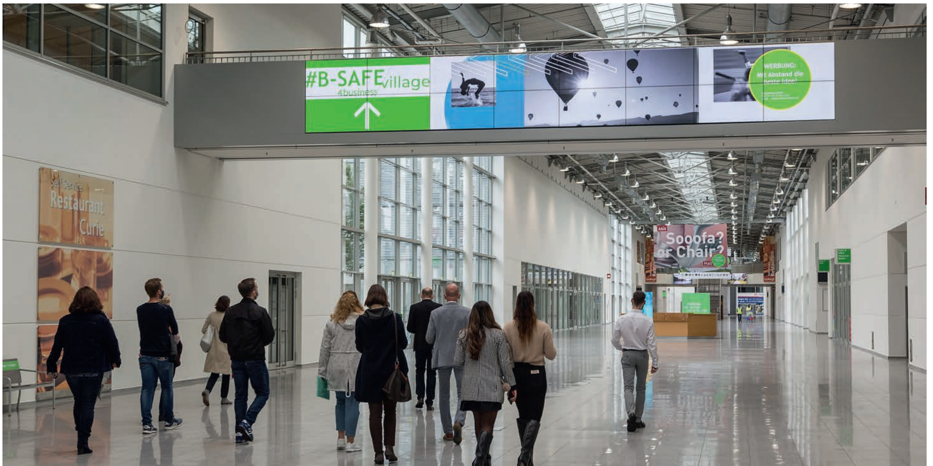
•Mit dem B-SAFE4business-Konzept zeigt die Koelnmesse, wie Messen in Zeiten von Corona funktionieren. •With the B-SAFE4business concept, Koelnmesse shows how trade fairs work in times of Corona.

The COVID-19 crisis has accelerated the digital transformation of the