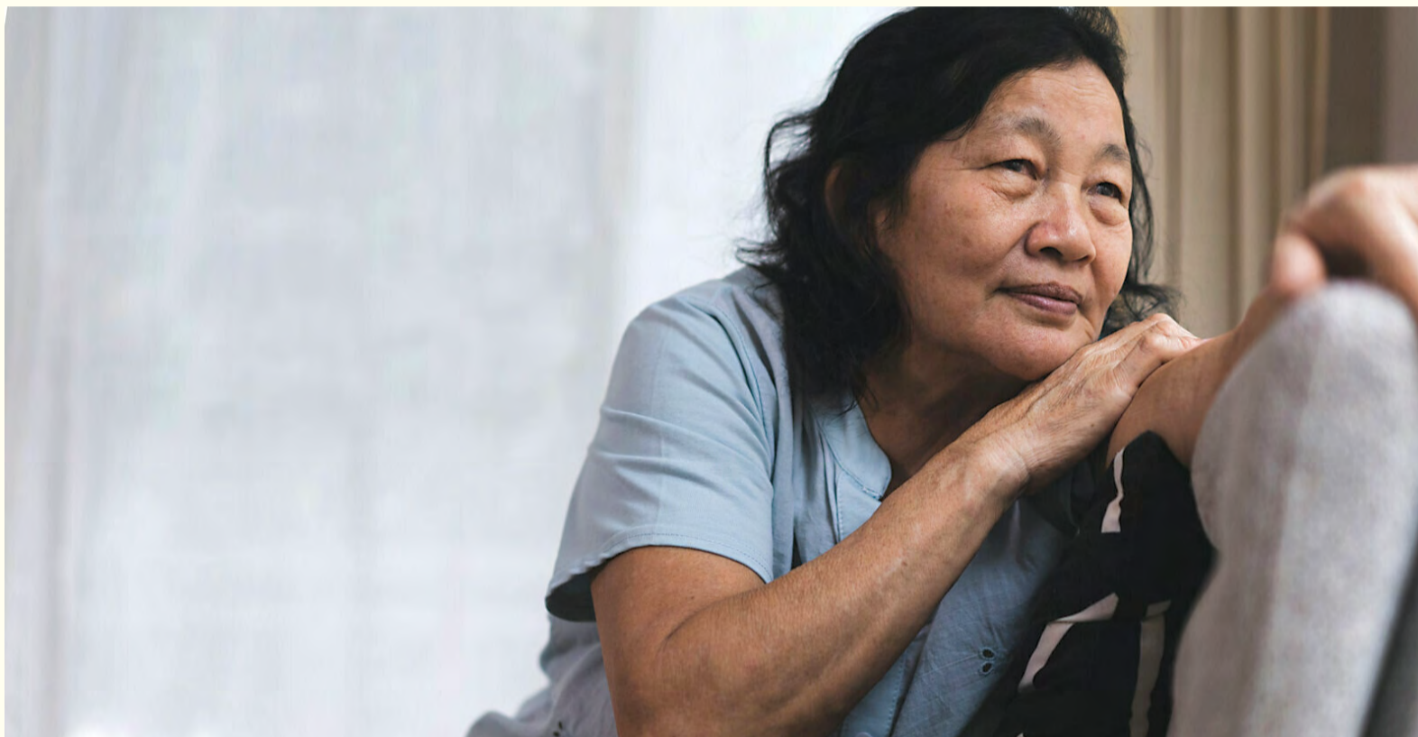
Nova studija je otkrila da se viši nivo društvene izoliranosti povezuje sa manjim brojem prirodnih zuba kod starijih, odraslih osoba u Kini.

NEW YORK, SAD/ ŠANGAJ, KINA: Veliki broj dokaza pokazuje da društvena izoliranost i usamljenost mogu uticati na sveukupno zdravlje i dobrostanje. Istraživači su u novoj studiji nastojali ispitati da li ovakva iskustva mogu biti pogubna za oralno zdravlje. Otkrili su da kod starijih odraslih osoba koje su društveno izolirane postoji veća mogućnost da nemaju zube i da brže vremenom gube zube u odnosu na osobe koje imaju više društvene interakcije.