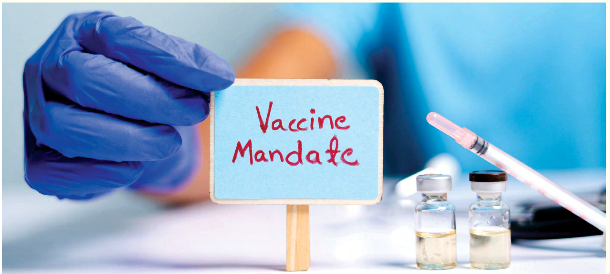
U prosjeku 9% stomatološkog osoblja u Engleskoj nije u potpunosti vakcinisano protiv COVID-a-19 i rizikuju da izgube posao jer će obavezna vakcinacija stupiti na snagu za četiri mjeseca.

LONDON, UK: Iako je Nova godina jedan od uzroka zbog kojeg su se neki ponadali da bi se kraj COVID-19 pandemije mogao nazirati, nadolazeće stope proširenosti Omikrona su proširile opću zabrinutost, i vrlo je malo znakova optimizma. Kako bi što više povećali vakcinaciju booster vakcinom u Engleskoj, vakcinacija će uskoro postati obavezan uslov za zapošljavanje za većinu zdravstvenih radnika, uključujući stomatologe i njihove timove koji rade u privatnom sektoru ili u Javnom državnom zdravstvu (engl. National Health Service, NHS). Kako se rok za vakcinaciju približava za osoblje koje želi zadržati svoj posao, od velikog je značaja procijeniti trenutnu političku situaciju u državi.