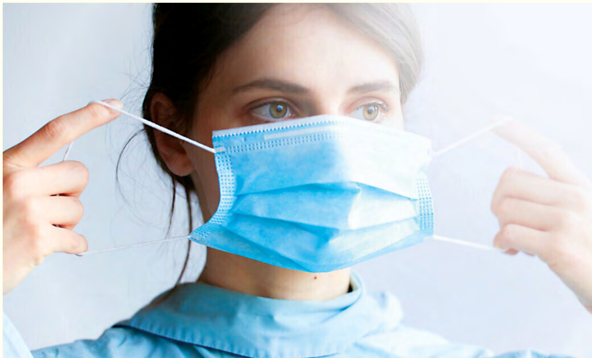
Istraživanje sa Medicine Greifswald univerziteta je pokazalo da se dentalni timovi u Njemačkoj nisu suočili sa većim rizikom od prenošenja SARS-CoV-2 virusa u odnosu na opću populaciju u periodu od januara do aprila 2020. godine.

GREIFSWALD, Njemačka: Studija koju su sproveli istraživači sa Medicine Greifswald univerziteta su uporedili rizik od prenošenja SARS-CoV-2 među dentalnim timovima sa rizikom prenošenja virusa među općim stanovništvom sa ciljem pojašnjavanja zaštitnih mjera u stomatološkom okruženju. Studija, koja se zasnivala na podacima iz Njemačke, je pokazala da stomatološki stručnjaci u državi nisu izloženi povećanom riziku od zaraze u odnosu na ostale.