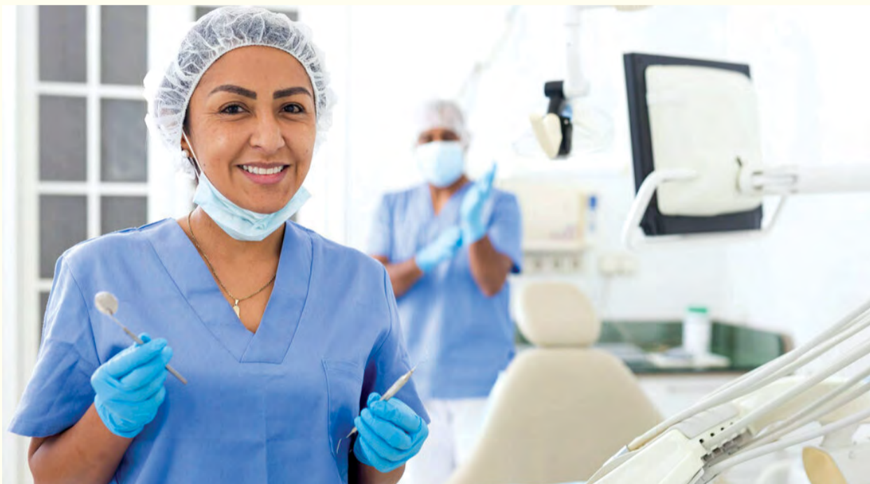
Porast u rodnoj raznolikosti poboljšava pružanje dentalnih usluga među Amerikancima. Međutim, osobe iz ruralnih područja se još uvijek suočavaju sa poteškoćama u pristupu stomatološkim uslugama.

NEW YORK, SAD: Oral Health Workforce Research Center (OHWRRC) je odgovoran za sprovođenje istraživanja o radnoj snazi u oblasti oralnog zdravstva u SAD-u te pomažu u planiranju unutar ove oblasti. OHWRRC se nalazi u Centru za nauke o radnoj snazi u oblasti zdravstva koji je dio Fakulteta za javno zdravstvo Albany univerziteta, New York State univerzitet. Jedno od glavnih područja na koje se Centar fokusirao posljednjih nekoliko godina jeste rodna raznolikost na radnim mjestima, a istraživači su nedavno sprovedenom studijom pokazali da se pristup uslugama poboljšavao kako je radna snaga u stomatologiji postajala više rodno raznolika.