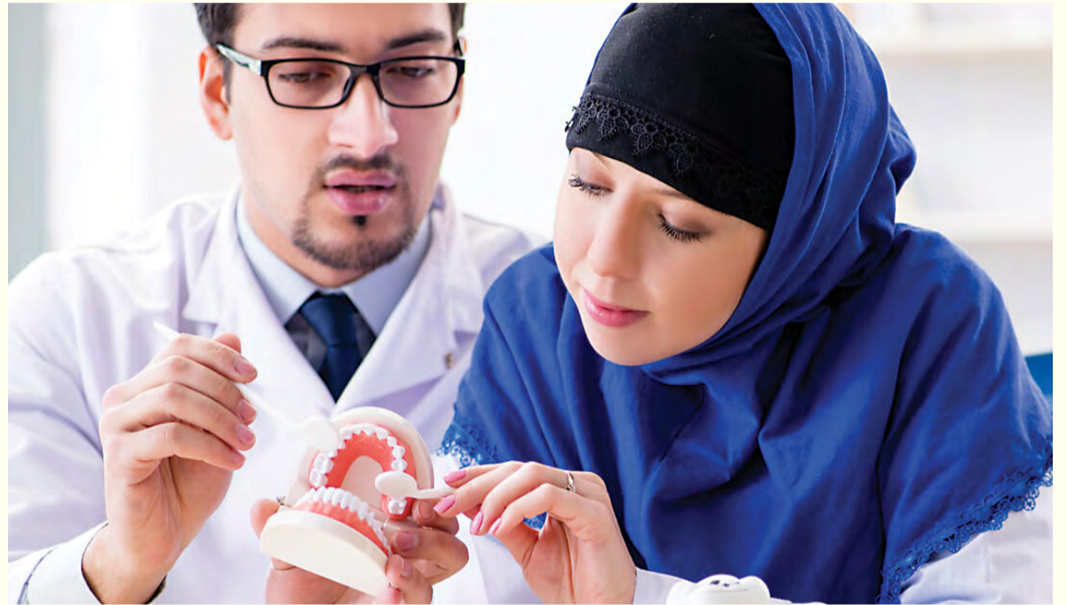
Program Nitaqat Saudijske Arabije ili Saudizacija, ima cilj kreirati više prilika za zapošljavanje za državljane Saudijske Arabije kako u stomatologiji tako i u drugim zdravstvenim poljima.

Arab News je objavio u oktobru prošle godine da je program Saudizacija već dovela do tog da u stomatološkom sektoru radi 30% Saudijsaca. Ovaj medij je u maju 2017. godine izvjestio da je Ministarstvo za kadrovske službe i socijalni razvoj prestalo zapošljavati stomatologe iz inostranstva kako bi se smanjila stopa nezaposlenosti među diplomantima stomatoloških fakulteta u Saudijskoj Arabiji. ■