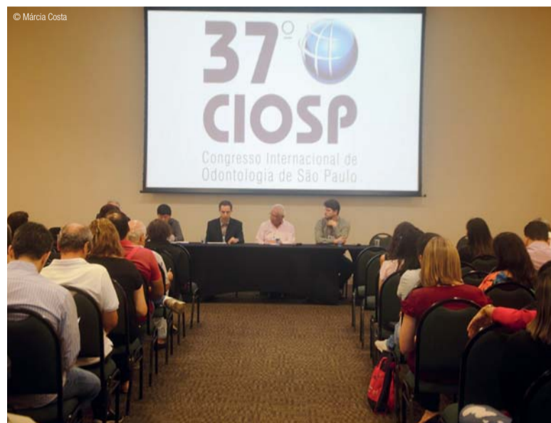
* Projeto Saúde Coletiva discute, tradicionalmente, o acesso democrático à saúde.