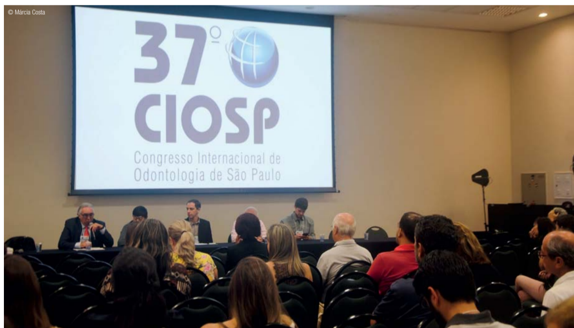
↑ Público é formado por gestores de saúde e profissionais da Odontologia.

Há ainda problemas com a gestão da atenção básica à saúde, destacou Capel. Segundo ele, hoje são 25 mil equipes de saúde bucal nos centros de especialidade odontológica, um serviço essencial para atendimento da população. A saúde bucal da população depende da presença de profissionais de saúde no sistema público.