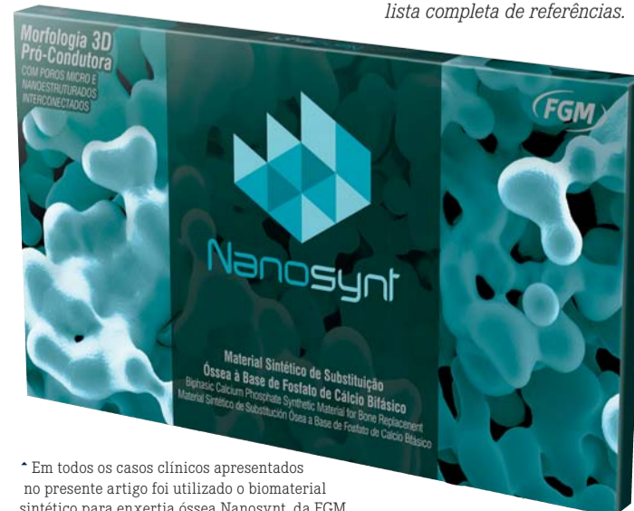
* Em todos os casos clínicos apresentados no presente artigo foi utilizado o biomaterial sintético para enxertia óssea Nanosynt, da FGM.

Nota editorial: A FGM disponibiliza uma lista completa de referências.