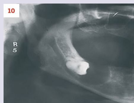
Afbeelding 1a. Radiolucente laesie.