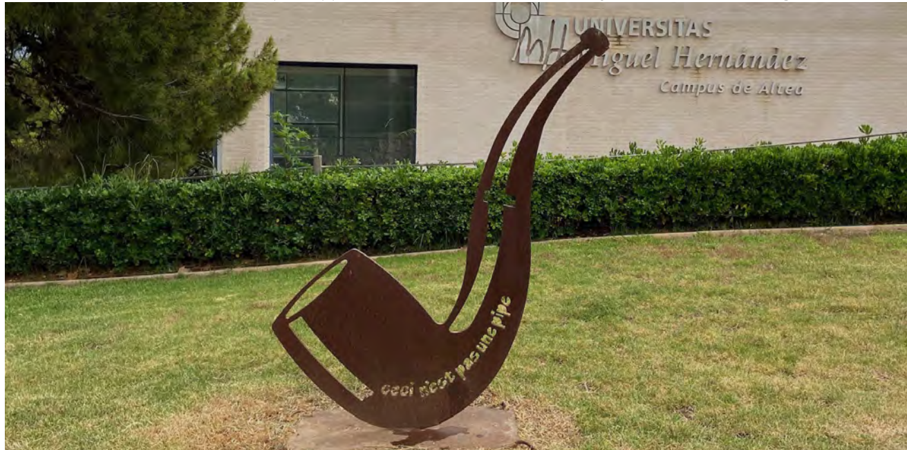
"Ceci n'est pas une pipe" (2009), escultura de Antoni Miró en homenaje a la famosa frase de René Magritte

Los programas de atención a domicilio son importantes porque proporcionan acceso a servicios de odontología a personas con dificultades físicas, problemas de salud general y recursos económicos limitados.