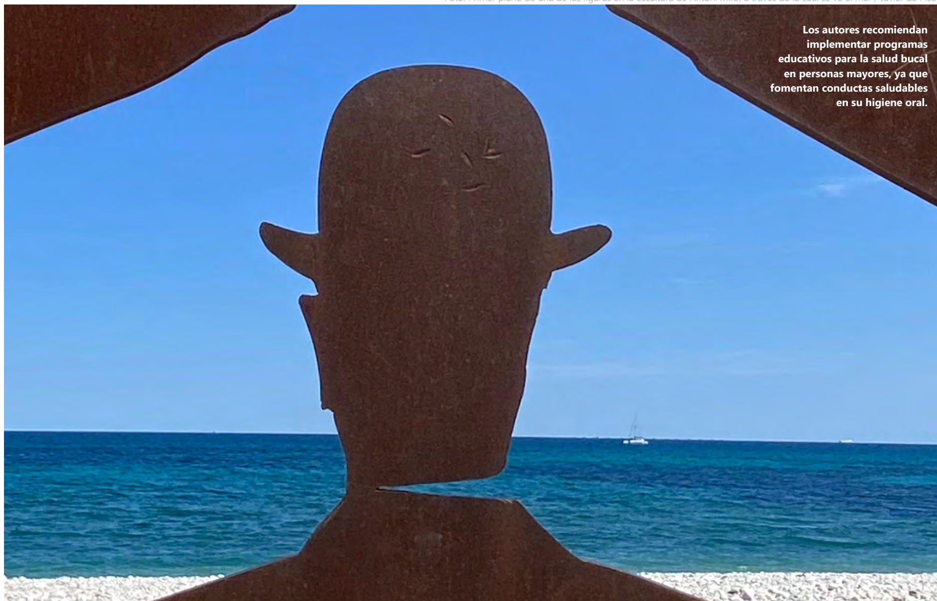
Foto: Primer plano de una de las figuras en la escultura de Antoni Miró, a través de la cual se ve el mar / Javier de Pisón

Los autores recomiendan implementar programas educativos para la salud bucal en personas mayores, ya que fomentan conductas saludables en su higiene oral.