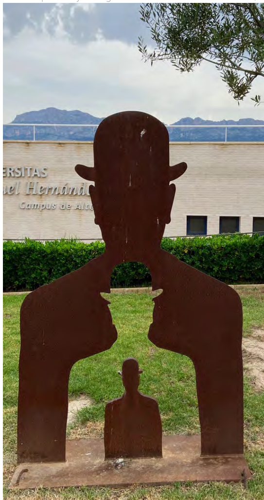
Foto: El "positivo" y el "negativo" de la escultura de Antoni Miró, expuesta frente al Palau de La Música de Altea en 2022 / Javier de Pisón