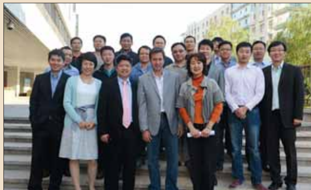
学员与两位老师合影

gIDE/UCLA国际牙科美学临床大师证书课程第三期课程于10月8日-11日在世界牙科培训中心举行。本次培训的两外老师分别是来自希腊雅典的Stavros Pelekanos医生和来自台北的彭炯焜医师。Stavros Pelekanos医生毕业于雅典大学牙科学院，并在德国弗莱堡大学获得了修复专业的博士学位。1994-2001，任雅典大学牙科学院美学修复系任教，并且是该系的助理教授。他发表过多篇专业论文、和书籍，并在2008年西班牙马德里的EAED大赛上获得第二名。目前Stavros Pelekanos医生在希腊雅典执业，专注于美学修复以及种植领域。他在前两天的培训中带领学员们进行了贴面修复的实操并进行了现场手术演示。