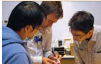
老师与学院进行探讨