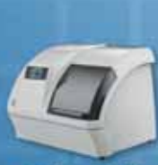
CAD / CAM