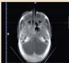
CBCT轴向，左侧横截面图像——鼻窦区的真实图像。

奇怪的是，当疼痛变得很强以至于处方止痛药不起作用的时候，她求助于苯海拉明以减轻炎症并帮助她夜间睡眠。另外，在此期间患者的下颌智