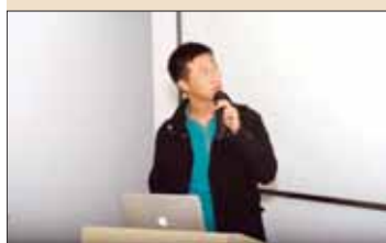
学员汇报自己的病例