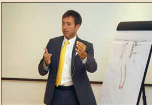
gIDE/UCLA国际美学临床大师证书课程第三期在京举行。