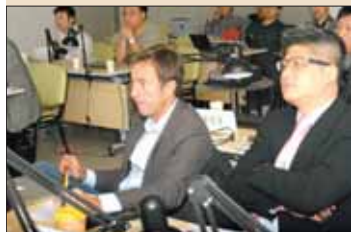
两位老师在聆听学员病例汇报