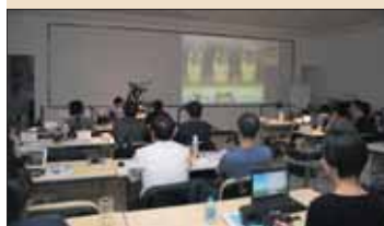
学员在观看老师的实操