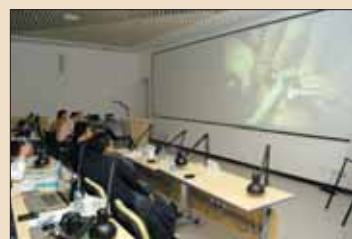
学员在观看现场手术