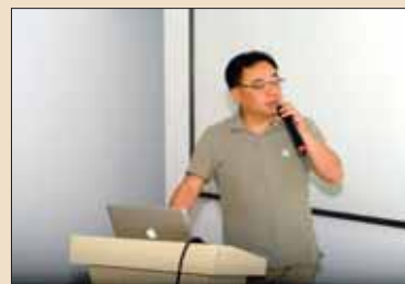
学员汇报自己的病例