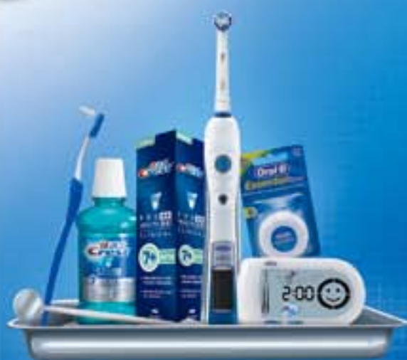
专业正畸口腔护理计划