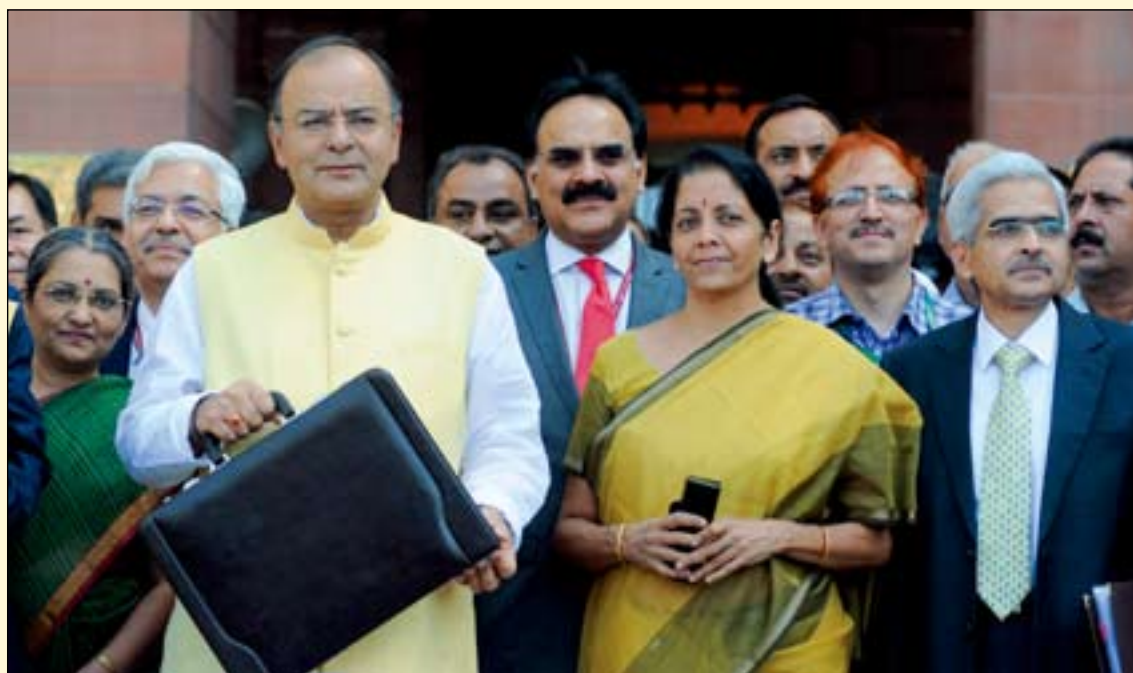
联邦财政部及企业事务和国防部部长Shri Arun Jaitley (左) 正在提交2014/2015年的总体预算 。

案中, 我们也可以看出政府为低收入的家庭和老人减少了税收, 新预算案对于穷人来说将是一线希望。他补充