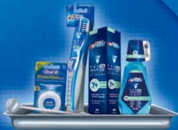
专业牙周口腔护理计划