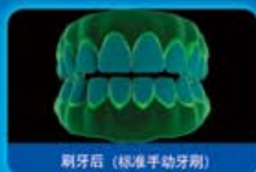
刷牙后 (标准手动牙刷)