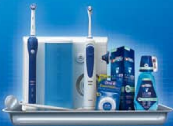
专业种植口腔护理计划