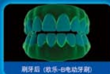
刷牙后 (欧乐-B电动牙刷)