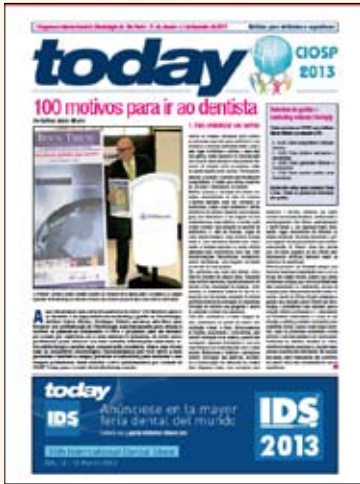
Portada del ejemplare de CIOSP Today, el periódico de ferias de Dental Tribune.

Oral-B, que instaló también stands de gigantescas dimensiones, utilizó CIOSP 2013 para lanzar su nueva revista, titulada Oral-B New América Latina , sobre la cual publicamos un artículo en esta edición. La empresa norteamericana Ultradent