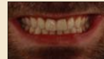
图7: 患者满意的微笑