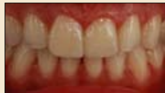
图6: Opal树脂抛光后的效果