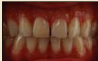
图1: 外观效果不满意的上下中切牙

可以得出结论，Opal树脂是一款可以通过简便的操作方法修复出自然美学效果的复合树脂材料。（图8） DT