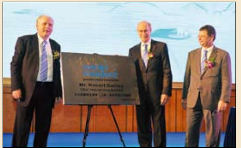
义获嘉伟瓦登特中国分公司成立

2012年10月26日义获嘉伟瓦登特” (Ivoclar Vivadent) 中国分公司成立仪式在中国上海举行。