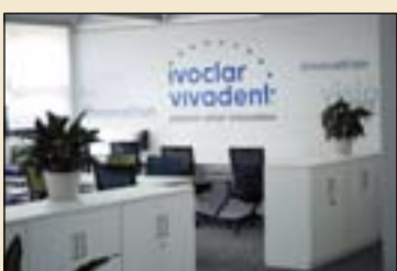
优雅舒适的员工办公区