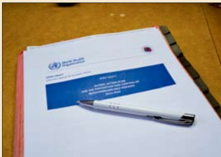
WHO's Global Action Plan on NCD's pays only lip service to oral health, according to the FDI.

在通知照会中, FDI也呼吁其成员与各自国家卫生官员联系, 确保口腔健康问题被纳入WHO即将到来的讨论计划及来年一月该组织下届执行委员会会议中。据WHO消息人士称, 该草案将在12月初于日内瓦举行的非正式会议上进行讨论, 会议将包括一