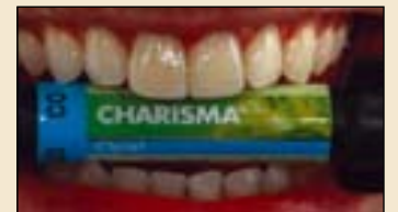
图8: 使用Opal树脂修复出的自然美学效果