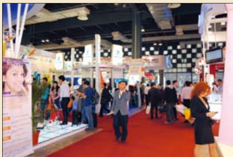
2012年10月24-27日上海口腔展成功举行。

WHO的非传染性疾病全球行动计划对于FDI在口腔健康方面的建议表示了口头上的赞同。DT