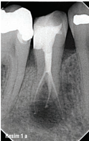
Resim 1 a-c: Kompleks kök kanal anatomileri.